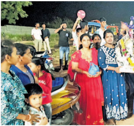
ఘటికేసర్ మున్సిపాలిటీ ఏదులాబాద్ చెరువు వద్ద వినాయక విగ్రహాల నిమజ్జనానికి వచ్చిన పిల్లలు, మహిళలు

కాప్రా/ఘటికేసర్: ఓ వైపు గణనాడులకు భక్తులు ఘనంగా పూజలు నిర్వహిస్తున్నారు. మరోవైపు విగ్రహాలను చెరువుల్లో నిమజ్జనం చేస్తుండడంతో సవరాతులు కోలాహలంగా జరుగుతున్నాయి. పలు చెరువుల వద్ద నిమజ్జనం సందడి నెలకొన్నది. కాప్రా, ఏదులాబాద్ పాలెం మినీపాండ్ల వద్ద విగ్రహాల నిమజ్జనం కొనసాగుతున్నది. కాప్రా చెరువు, మినీపాండ్లలో వినాయకులను నిమజ్జనం చేసినందుకు అధికారులు ఐదు క్రేస్లను అందుబాటులో ఉంచగా, మరోవైపు నిమజ్జన శిథిలాలను ఎప్పటికప్పుడు జీవావేమనీ సిబ్బంది వాహనాల్లో జవహర్ నగర్ కు తరలిస్తున్నారు. ఘటికేసర్ మున్సిపాలిటీ ఏదులాబాద్ చెరువు, పోచారం మున్సిపాలిటీ పరిధిలోని మీరాలం కుంట్ల, హనుమకలంట్లో వినాయకులను నిమజ్జనం చేస్తున్నారు. చెరువుల వద్ద భక్తులు ఇబ్బందులు కలుగుతున్నాడని పోలీసుల బందోబస్తును ఏర్పాటు చేశారు.