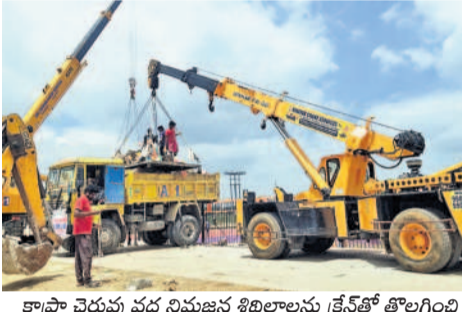
కాప్రా చెరువు వద్ద నిమజ్జన శిథిలాలను క్రేస్లో తోలిగించి జీవావేమనీ వాహనాల్లో తరలిస్తున్న దృశ్యం