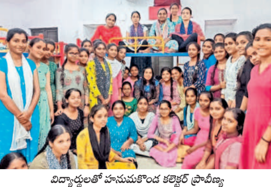
విద్యార్థులతో హనుమకొండ కలెక్టర్ ప్రావీణ్య