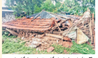
గార్ : కోమటగూడలో కూలిన ఇళ్లు (ఫైల్)