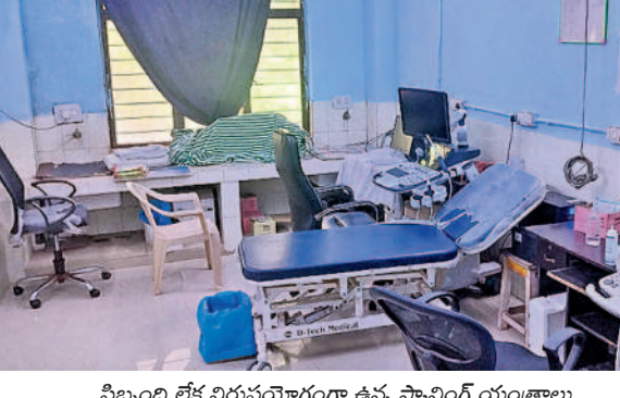
సిబ్బంది లేక నిరుపచారంగా ఉన్న స్కానింగ్ యంత్రాలు