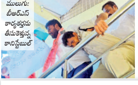
ములుగు: బీఆర్ఎస్ కార్యకర్తలను తీసుకెళ్తున్న కానిస్టేబుల్