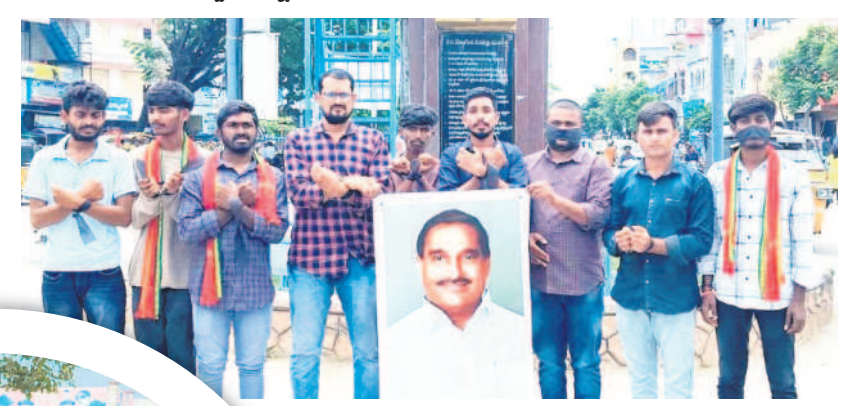
సిరిసిల్ల టౌన్ : జిల్లా కేంద్రంలోని నేతలను చౌరస్తాలో నిరసన తెలుపుతున్న బీఆర్ఎస్ నాయకులు