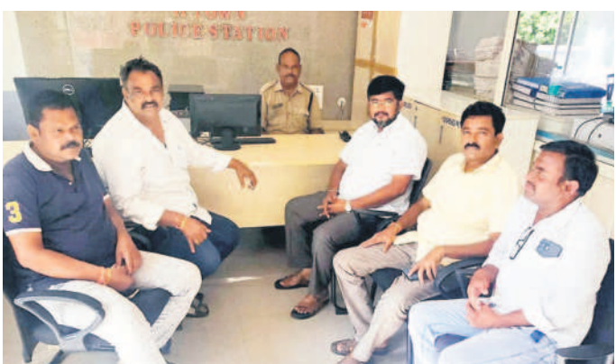
కరీంనగర్ కార్పొరేషన్ : టూ టూన్ పోలీస్ స్టేషన్లో బీఆర్ఎస్ నాయకులు