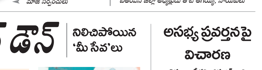
విణవక : పోలీస్ స్టేషన్లో ఎల్లారెడ్డిమేట: పోలీస్ స్టేషన్ ఎదుట అరెస్టు అయిన బీఆర్ఎస్ జిల్లా అధ్యక్షుడు తోట ఆగయ్య, నాయకులు