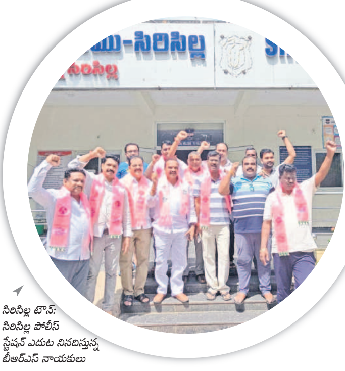
సిరిసిల్ల టౌన్: సిరిసిల్ల పోలీస్ స్టేషన్ ఎదుట నిరసన వ్యక్తం చేసిన బీఆర్ఎస్ నాయకులు