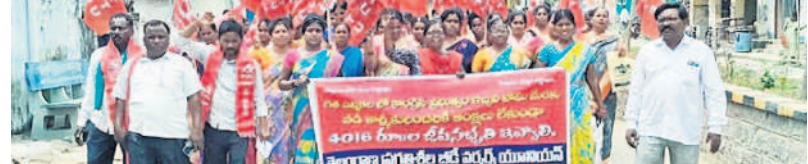
జిల్లావేటిలో రాత్రి నిర్వహిస్తున్న బీడీ కార్యకులు