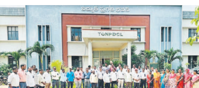
టీవోవో 954, ఎన్వోవో 37 ఉత్తరులును రద్దు చేసి ఇటీవల కల్పించిన అదేవార్ ప్రమాదాన్ని రూల్ ఆఫ్ రిజిస్ట్రేషన్ రూల్ ప్రకారం క్రమబద్ధీకరించాలని డిమాండ్ చేశారు. రాష్ట్ర విద్యుత్ ఎన్సీ, ఎన్సీ ఉద్యోగుల ఇకాస్ పిలుపు మేరకు జిల్లా కేంద్రంలోని విద్యుత్ భవన కార్యాలయం ఎదుట భోజన విరామ సమయంలో ఉద్యోగులు శుక్రవారం నిరసన కార్యక్రమం చేపట్టారు.