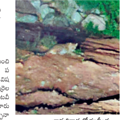
గ్రామశివారులో కూలీలకు కనిపించిన చిరుత

సారంగాపూర్, సెప్టెంబర్ 13 : నిజామాబాద్ రూరల్ మండలంలోని మల్కాపూర్(ప) గ్రామశివారులో చిరుత సంచారం కొన్ని రోజులుగా కలకలం సృష్టిస్తోంది. నెలరోజుల నుంచి ఇదే ప్రాంతంలో చిరుత సంచారం ఉండడంతో గ్రామస్థులు తీవ్ర భయాందోళనలకు గురవుతున్నారు. గ్రామానికి చెందిన ఓ రైతు తన పాలనుంచి కూలీలతో కలిసి బీచ్లో శుక్రవారం మేకువజామున వస్తుండగా చిరుత కనిపించింది. గమనించిన కూలీలు తమ సెల్ ఫోన్లలో చిరుత సంచారాన్ని దృశ్యాలను చిత్రీకరించి గ్రామానికి చెందిన గ్రామంలో పోస్టు చేశారు. దీంతో గ్రామస్థులు భయాందోళన చెందుతున్నారు. అగస్టు 15న ఓ మందపై చిరుత దాడి చేయగా ఒక గొర్రె మృతి చెందింది. మళ్ళీ 15 రోజులకు మరోసారి మందపై చిరుత దాడి చేయగా.. రెండు గొర్రెలు తీవ్రంగా గాయపడి ప్రాణ