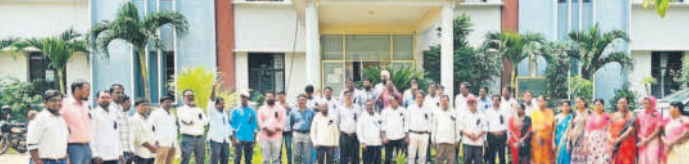
జిల్లావేటి/విగ్గట్ల, సెప్టెంబర్ 13