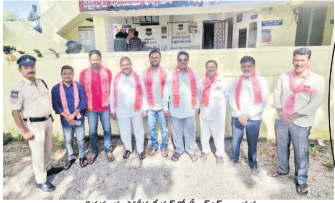
బీత్సూరు పోలీసుస్టేషన్లో బీఆర్ఎస్ నాయకులు