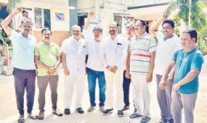
కామారెడ్డిలో పోలీసుల అదుపులో బీఆర్ఎస్ నాయకులు