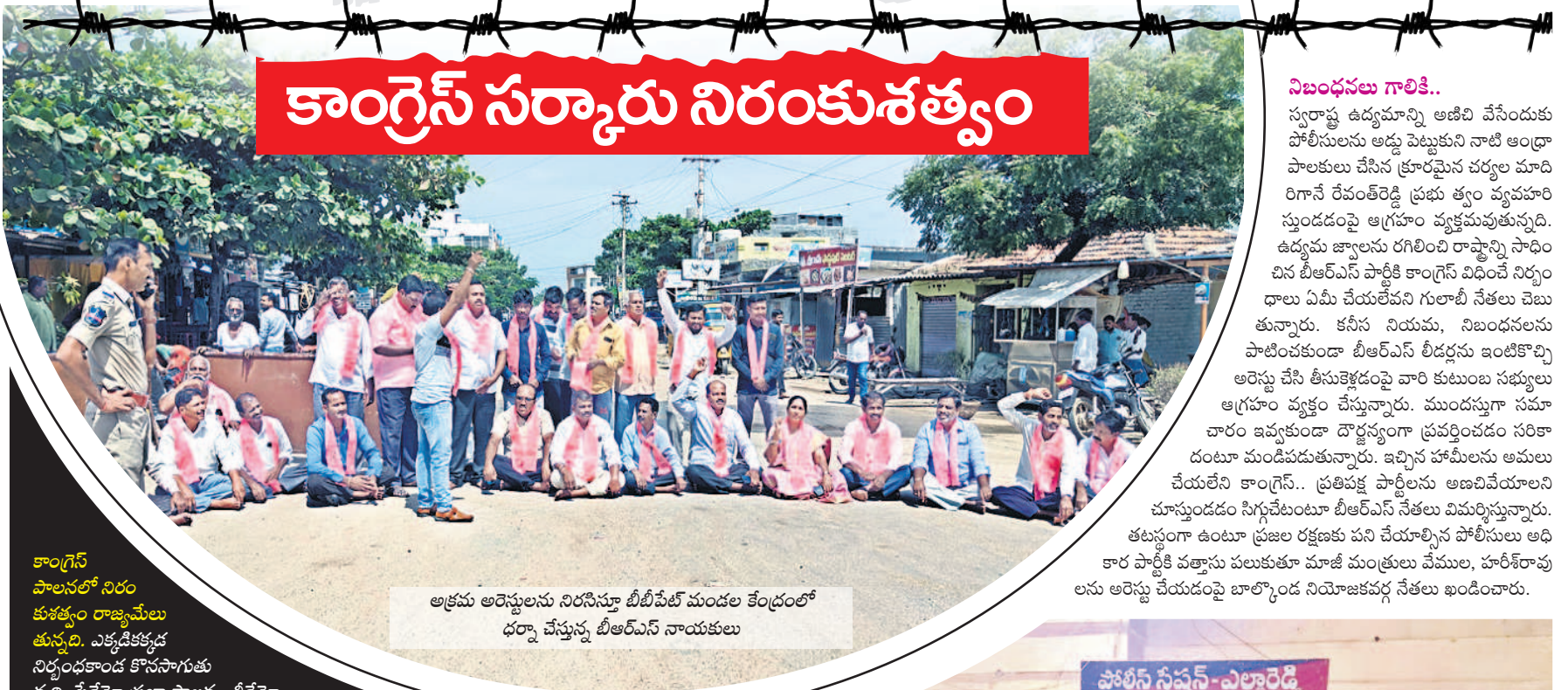
అక్రమ అరెస్టులను నిరసనగా బీబీసీలో మండల కేంద్రంలో ధర్నా చేస్తున్న బీఆర్ఎస్ నాయకులు

కాంగ్రెస్ పాలనలో నిరంకుశత్వం రాజ్యమేలు తున్నది. ఎక్కడికక్కడ నిర్బంధకాండ కొనసాగుతున్నది. పేదమో ప్రజా పాలన.. తీరేమో నియంతృత్వ పాలన. ఉమ్మడి జిల్లాలో శుభ్ర వారం జరిగిన అరెస్టుల వర్షం అందుకు నిలు వెత్తు నిదర్శనం. బీఆర్ఎస్ నేతలు, కార్యకర్తల లక్ష్యాంగా పోలీసులు జాలు ప్రదర్శించారు. అర్ధ రాత్రి వేళ ఇంట్లోను ముట్టడించి గులాబీ శ్రేణులను అదుపులోకి తీసుకున్నారు. తెల్లరాక కూడా కనిపించిన వారిని కనిపించినట్లు అరెస్టు చేసి లాజికలకు తరలించారు. సొత్త వస్తుల మీద బయటికి వెళ్లే వారిని సైతం నిర్బంధించారు. హైదరాబాద్ కు వెళ్లే ముఠాలో అన్నా వినకండా పోలీసుస్టేషన్ కు తీసుకెళ్లి పొద్దుతా కూర్చోబెట్టారు. ప్రభుత్వ అధికారంలో ఇష్టానుసారంగా వ్యవహరిస్తూ బీఆర్ఎస్ నేతలపై బల ప్రయోగం చేయడంపై సర్వత్రా నిరసన వ్యక్తమవుతున్నది. -నిజామాబాద్, సెప్టెంబర్ 13 (నమస్తే తెలంగాణ ప్రతినిధి)