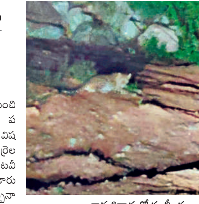
గ్రామశివారులో కూలీలకు కనిపించిన చిరుత

సారంగపూర్, సెప్టెంబర్ 13 : నిజామాబాద్ రూరల్ మండలంలోని మల్కాపూర్(ప) గ్రామశివారులో చిరుత సంచారం కొన్ని రోజులుగా కలకలం సృష్టిస్తోంది. నెలరోజుల నుంచి ఇదే ప్రాంతంలో చిరుత సంచారంపై గ్రామస్థులు తీవ్ర భయాందోళనలకు గురవుతున్నారు. గ్రామానికి చెందిన ఓ రైతు తన పాలం నుంచి కూలీలతో కలిసి బీహార్లో శుక్రవారం వేకువజామున వస్తుండగా చిరుత కనిపించింది. గమనించిన కూలీలు తమ సెల్ ఫోన్లలో చిరుత సంచారాన్ని దృశ్యాలను చిత్రీకరించి గ్రామానికి చెందిన గ్రూప్లో పోస్టు చేశారు. దీంతో గ్రామస్థులు భయాందోళన చెందుతున్నారు. అగస్టు 15న ఓ మందపై చిరుత దాడి చేయగా ఒక గొర్రె మృతి చెందింది. మళ్ళీ 15 రోజులకు మరోసారి మందపై చిరుత దాడి చేయగా.. రెండు గొర్రెలు తీగ్రంగా గాయపడి ప్రాణ