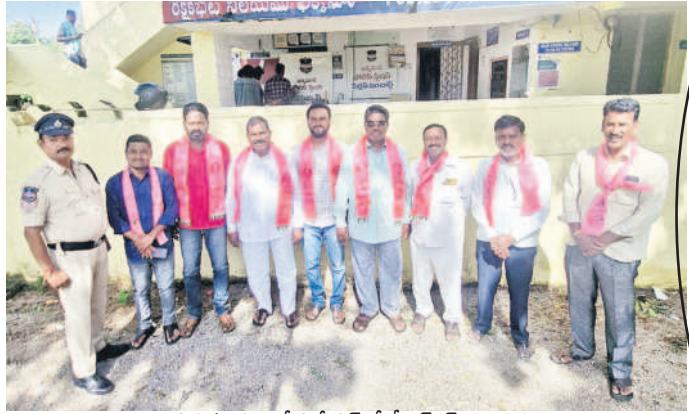
బీత్సూరు పోలీసుస్టేషన్లో బీఆర్ఎస్ నాయకులు