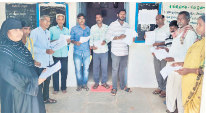
బాన్సువాడ మండలం బోర్డు గ్రామ పంచాయతీలో గ్రామస్థల సమక్షంలో ఓటరు జాబితాను ప్రదర్శిస్తున్న కార్యదర్శి నాయికమ్మార

ఖిలేవాడి/కామారెడ్డి, సెప్టెంబర్ 13 : స్థానిక సంస్థల పోరుకు రంగం సిద్ధమవుతున్నది. ఎన్నికల సన్నాహాల్లో నిమగ్నమైన అధికార యంత్రాంగం.. పంచాయతీల వారిగా ము సాయిదా ఓటరు జాబితాను శుక్రవారం విడుదల చేసింది. ఉమ్మడి జిల్లాలో మొత్తం 14.60 లక్షల ఓటర్లు ఉన్నట్లు లెక్క తేల్చింది. రెండు జిల్లాల్లోనూ మహిళలే అధికంగా ఉండడం విశేషం. అన్ని పంచాయతీల్లో జాబితాలను అధికారులు ప్రదర్శనకు ఉంచారు. వాటిపై అభ్యంతరాలకు ఆవకాశం కల్పించిన అధికారులు.. వాటిని పరిష్కరించి, ఈ నెల 28న తుది జాబితాను విడుదల చేయనున్నారు.