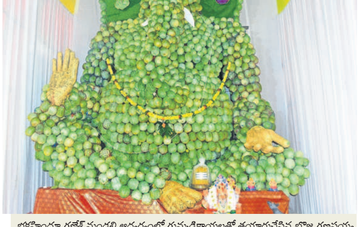
భక్తహిందూ గణేశ్ మండలి ఆధ్వర్యంలో గుమ్మాకాయలతో తయారుచేసిన బొజ్జ గణపయ్య