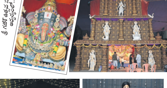
శ్రీ గణేశ్ విగ్రహం ఆధ్వర్యంలో..