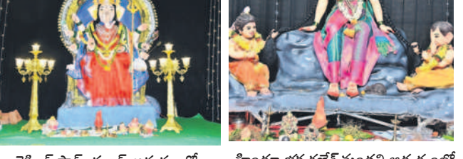
రైసింగ్ స్టార్ యాత్ర ఆధ్వర్యంలో..