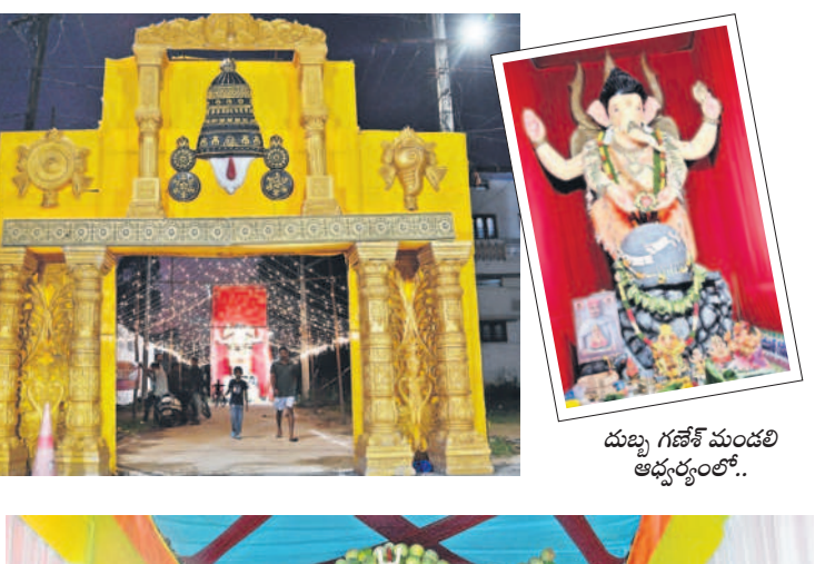
దుబ్బ గణేశ్ మండలి ఆధ్వర్యంలో..

• జిల్లా కేంద్రంలో ఆకట్టుకుంటున్న సెట్టింగులు • రంగురంగుల విద్యుద్దీపాలతో ప్రత్యేక అలంకరణ పట్టణంలో వాడవాడలా గణనాథులు కొలువైపోయారు. కుల, యువజన సంఘాల ఆధ్వర్యంలో వివిధ రూపాల్లో ఉన్న వినియోగదారు ప్రతిష్ఠించిన ప్రత్యేక పూజలు నిర్వహిస్తున్నారు. రాత్రి సమయాల్లో మండపాల వద్ద సాంస్కృతిక, భజన కార్యక్రమాలు ఏర్పాటు చేస్తున్నారు. వివిధ సెట్టింగులు ప్రత్యేక ఆకర్షణగా నిలుస్తున్నాయి. గణనాథులను తిలకించేందుకు భక్తులు తరలివస్తున్నారు.