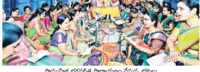
సామూహిక భగవద్దీప పారాయణం చేస్తున్న భక్తులు

కోహిల్, సెప్టెంబర్ 14: జోహరాబాద్ పట్టణంలోని రాజస్థాని గణేశ్ యాత్రీ ఆసోషియేషన్ ఏర్పాటు చేసిన రాజస్థాని వివాదం మండలంలో గీత జ్ఞాన వాహినీ అధ్యక్షులతో శనివారం సామూహిక సంపూర్ణ భగ