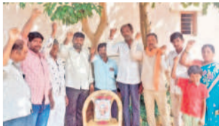
కందిలో సీతారాం ఏచూరి చిత్రపటం వద్ద సమావేశం చేస్తున్న సీపీఎం నాయకులు