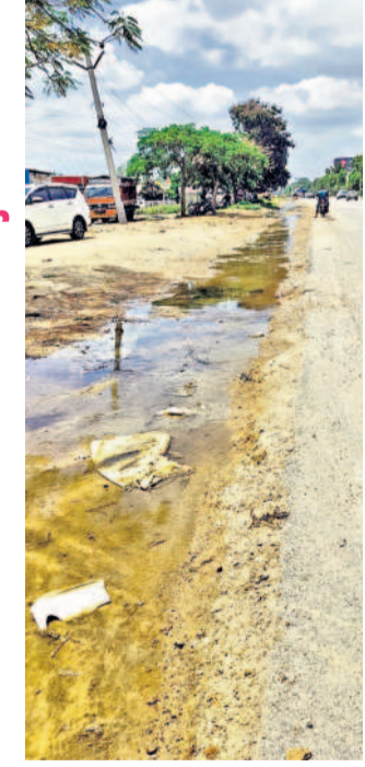
జాతీయ రహదారిని పక్కనుంచి ప్రవహిస్తున్న మురికి నీరు

కంది, సెప్టెంబర్ 14: కంది నుంచి వెళ్లే జాతీయ రహదారి ప్రమాదాలకు నిలయంగా మారింది. సంగారెడ్డి వెళ్తు సుంచి వచ్చే రహదారిని ఆనుకొని మురికి నీరంతా రోడ్డువకకు పరులై పారుతున్నా పట్టించుకునే నాభుడే కరువయ్యాడు. రహదారికి ఇరువైపులా గుంతల్లో నీరు నిల్చి ఉండటంతో వాహనదారులు ఇబ్బందులు పడుతున్నారు. ఈ రహదారిపై నిమిషంలో వేల సంఖ్యలో వాహనాలు తిరుగుతుంటాయి. రోడ్డు దిగితే వాహనాలు మోసిన వాహనదారులు భయందోహకం గురవుతున్నారు. జిల్లా, మండల అధికారులు నిత్యం ఈ రహదారిపై రాకపోకలు సాగిస్తున్న పట్టించుకోవడం లేదని స్థానికులు ఆరోపిస్తున్నారు. ఇప్పటికే సమస్యను పరిష్కరించాలని కోరుతున్నారు.