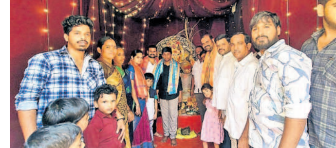
బొల్లారం: గణపతి మండలంలో ప్రత్యేక పూజలు చేస్తున్న కార్యకర్తలకు సంఘం నాయకులు

పటాన్చెరు, సెప్టెంబర్ 14: పటాన్చెరు డివిజన్ పరిధిలోని పలు వినాయక మండపాల్లో కార్యోద్యమం మొదలుపెట్టిన ప్రత్యేక పూజలు చేశారు. పటాన్చెరు పట్టణంలోని శాంతివగ్గ, నాయకోటి బస్టి, సాయిగణేశ్ కాలనీ, గౌతమ్ నగర్, బ్యూందావన్ కాలనీలో వినాయక మండపాల పూజలు ఆహారం మేరకు కార్యోద్యమం పూజల్లో పాల్గొన్నారు. అన్నదాన కార్యక్రమాలను ప్రారంభించారు. వినాయక నవరాత్రి ఉత్సవాలను నిర్వహించు చక్కగా నిర్వహిస్తున్నారని అభినందించారు. నిమజ్జనాలకు పూర్తిస్థాయిలో జీవితం ఎన్ని అధ్యక్షులతో ఏర్పాటు చేశామన్నారు.