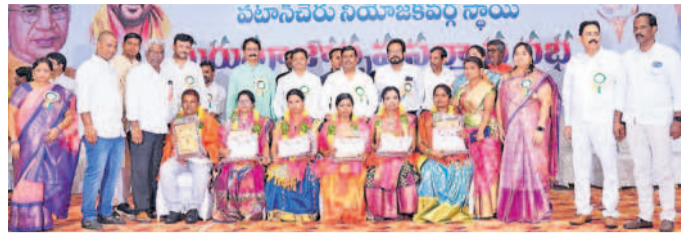
ప్రైవేట్ పాఠశాలల ఉత్తమ ఉపాధ్యాయులను సన్మానిస్తున్న ఎమ్మెల్యే మహిపాలెరెడ్డి