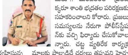
మాలకు పాల్గొనే చర్యలు తప్పని పాపై రించారు. గణేశ్ నిమజ్జనాలను శాంతియుతంగా సందర్శించి మాట్లాడుతూ.. మండలంలో ప్రతి ఒక్కరూ శాంతి భద్రతల పరిరక్షణకు సహకరించాలని కోరారు.

రాంకోడ్, సెప్టెంబర్ 14: రాంకోడ్ ఎస్సెగ్ నారాయణ శనివారం బాధ్యతలు చేపట్టారు. ఇక్కడ విద్యలు నిర్వహించిన ఎస్సెగ్ కార్యదర్శిని సంగారెడ్డి డివిజన్ లోకి బదిలీపెట్టే వ్యవహారం సంగారెడ్డి డివిజన్ లోని ఎస్సెగ్ విద్యలు నిర్వహిస్తున్న మాలకు పాల్గొనే చర్యలు తప్పని పాపై రించారు. గణేశ్ నిమజ్జనాలను శాంతియుతంగా సందర్శించి మాట్లాడుతూ.. మండలంలో ప్రతి ఒక్కరూ శాంతి భద్రతల పరిరక్షణకు సహకరించాలని కోరారు. ప్రజలు సమస్యలను సేరుగా పోలీస్ స్టేషన్ కు వచ్చి ఫిర్యాదు చేసుకోవాలి.