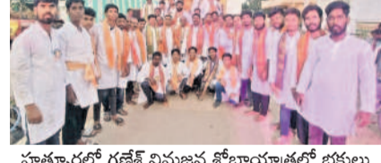
హత్తూర్లో గణేశ్ నిమజ్జన శోభాయాత్రలో భాగస్వామి

హత్తూర్, సెప్టెంబర్ 14: గణేశ్ నవరాత్రి ఉత్సవాలు హత్తూర్ మండలంలో ఘనంగా కొనసాగుతున్నాయి. శనివారం హత్తూర్ తోపాటు పలు గ్రామాల్లో వివాహాల నిమజ్జనాలను వైభవంగా నిర్వహించారు. గణేశ్ మండలాల వద్ద అన్నదాన కార్యక్రమాలు చేపట్టిన నిర్వాహకులు సాయంత్రం గణనాభుడి విగ్రహం ఊరేగింపు నిర్వహించారు. ఊరేగింపులో విన్నూరులు, యువకులు ఉత్సాహంగా పాల్గొని సందడి చేశారు.