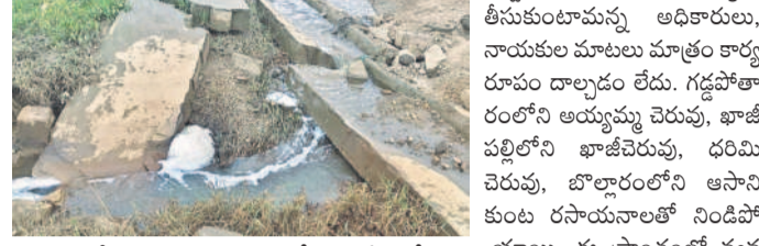
ఖాజీపల్లి పారిశ్రామికవారడంలో వర్ష నీటిలో ప్రవహిస్తున్న రసాయన వ్యర్థాలు(ఫైల్)

ద్వారా బయటకు పడుతుండగా గ్రామస్థులు పట్టుకొని పీసీబీ అధికారులకు ఫిర్యాదు చేశారు. వర్షాలు కురిసిన వారం రోజులపాటు ఇదే తీరుగా పరిశ్రమలు వ్యవహరించాయి. శాంపిల్స్ సేకరించిన పీసీబీ అధికారులు చచ్చుకు చేయడం లేదని, ఇదే పరిశ్రమపై ఫిర్యాదులు పీసీబీ వెంటనే సెక్రటరీ కలిసి స్పందించాలని కోరారు. కాల్లంబవల్ల రసాయన పరిశ్రమల కాలుష్యం పాగులు, రసాయన వ్యర్థాల విడుదల ఇక్కడ నిత్య ప్రక్రియగా కొనసాగుతున్నది. కాలుష్యకారాలిగా చెరువులు, కుంటలు పారిశ్రామిక వారడంలోని చెరువులు, కుంటలు ఇప్పటికే పూర్తిగా కాలుష్యం బారిన