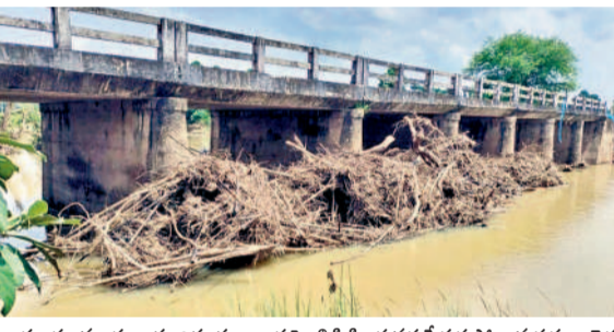
బయ్యారం మండలం పందిపంపుల వాగుపై బ్రిడ్జి పీల్చర్ వద్ద పేదకుపోయిన కర్రలు, చెత్త