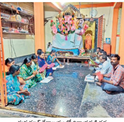
హనుమాన్ దేవాలయంలో వినాయకుడి వద్ద భజనలు చేస్తున్న భక్తులు