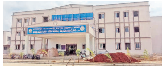
నిర్మాణం పూర్తి దశకు చేరుకున్న జిల్లా దవాఖాన, మెడికల్ కళాశాల