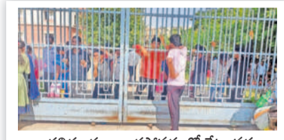
తల్లిదండ్రులు రాకపోవడంతో గేటు వద్ద దీనంగా చూస్తున్న విద్యార్థులు

■ కిటికీలూడుతున్న కమలాపూర్ టీసీ సంతోష బాలుర పాఠశాల, కళాశాల ప్రాంగణం