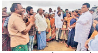
బ్రిడ్జి సమస్యను మంత్రి సీతక్క, ఎమ్మెల్యే, ఎంపీకి తెలుపుతున్న గ్రామస్థుడు (ఫైల్)

బయ్యారం, సెప్టెంబర్ 14 : సార్వత్రిక వచ్చారు.. సమస్య చెప్పుకుంటే వెంటనే పరిష్కారమవుతుందని ఆశించిన ప్రజలకు భంగపాటు తప్పలేదు. స్వయంగా మంత్రి సీతక్క హామీ ఇచ్చినా అధికారులు మాత్రం సమస్య పై కనెక్ట్ చేయలేదు. ఈ నెల 1న మహబూబాబాద్ జిల్లాలో వరద మంచెత్తిన విషయం తెలిసింది. 2న బయ్యారం మండలంలోని అల్లి గూడెం శివారంలోని పందిపంపుల వాగును మంత్రి సీతక్క, ఎంపీ బలరాంనాయక్, ఎమ్మెల్యే కొర్రం కనకయ్య సందర్శించారు. ఈ క్రమంలో అక్కడి ప్రజలు వాగుపై నిర్మించిన బ్రిడ్జి పీల్చర్ దగ్గరగా వెళుతుంటే వరద సమయంలో కర్రలు, చెత్త బ్రిడ్జి కింది భాగంలో చిక్కుకొని నీటి ప్రవాహానికి అడ్డు తగులుతుందని, దీంతో గ్రామంలోకి నీరు చేరి ఇబ్బంది పడుతున్నామని తెలిపారు. ఈ విషయాన్ని అర్ అండ్ టి అధికారులకు చెప్పామని, రేపు మధ్యాహ్నం వరకు చెత్తను తొలగిస్తారని, తేని వక్రంలో ఎమ్మెల్యేకు ఫోన్ చేసి చెప్పాలని ఎంపీ బలరాంనాయక్ తెలిపారు. అయితే పది రోజులు గడుస్తున్నా ఇంత వరకు బ్రిడ్జి కింద ఉన్న కర్రలు, చెత్తను అధికారులు తొలగించకపోవడంతో గ్రామ ప్రజలు మంత్రి, ఎంపీ హామీ ఇచ్చినా పని జరగలేదంటూ అధికారుల తీరుపై ఆనందం వ్యక్తం చేస్తున్నారు.