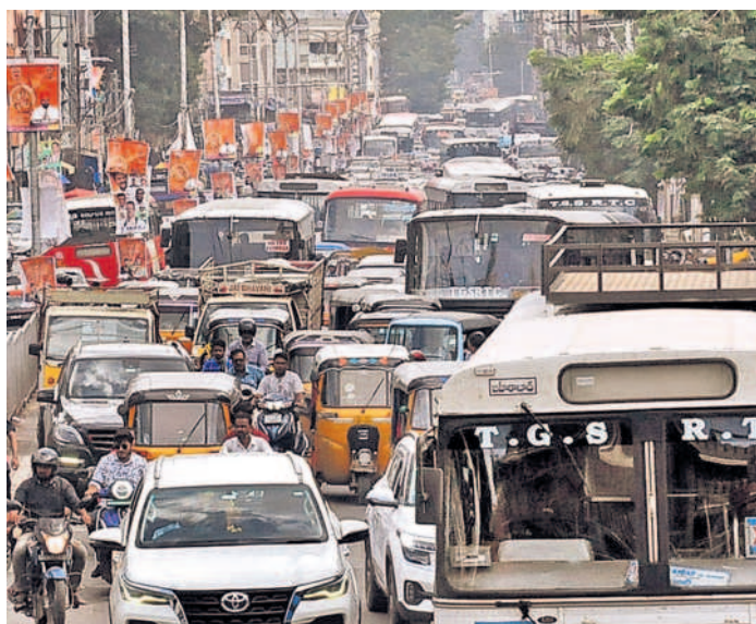
గతేళ్ల నవరాత్రులు, వరుస సెలవుల నేపథ్యంలో ఆదివారం మోజంజాపా మార్కెట్ జంక్షన్లో భారీగా ట్రాఫిక్ జామ్ ఏర్పడింది. దీంతో వాహనదారులు తీవ్ర ఇబ్బందులు పడ్డారు.