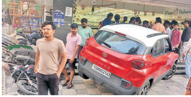
ఎన్ఆర్ నగర్ లోని సూపర్ మార్కెట్ లోకి దూసుకెళ్లిన కారు

వెంగళరావునగర్, సెప్టెంబర్ 15: పీకల దాశా తాగగా.. ఆ మత్తులోనే కారు డ్రైవింగ్ చేశాడో సాఫ్ట్ వేర్ ఇంజనీర్. అతివేగంతో దూసుకొచ్చిన అతడి కారు ఎన్ఆర్ నగర్ లోని ట్రాఫిక్ పోలీసు ములుపు వద్ద అదుపుకొట్టి.. మూడు బైకులు డీకొట్టుకుంటూ.. అదే స్పెడ్ లో సూపర్ మార్కెట్ లోకి దూసుకెళ్లింది. ప్రాణ భయంతో అక్కడున్న