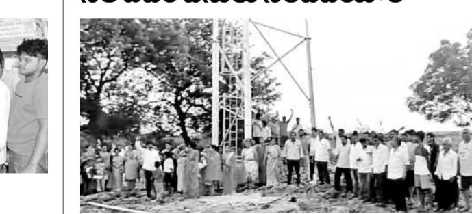
సెల్ టవర్ వద్ద ధర్మా నిర్వహిస్తున్న కాలనీ నాయులు

మధిర, సెప్టెంబర్ 15 : పట్టణంలోని లడకజిల్లాలో గా మిలీనియం స్కూల్ దగ్గరలోని మున్నేరు ఒడ్డు వద్ద కొత్తగా ఏర్పాటు చేస్తున్న సెల్ టవర్ పనులు తొలగించాలని లడకజిల్లా నివాసులు ఆదివారం సెల్ టవర్ నిర్మాణ స్థలం వద్ద ధర్మా చేపట్టారు. సెల్ టవర్ ఏర్పాటు చేస్తే రేడియేషన్ వల్ల చెల్లబెట్టాలి, వృద్ధులు, అనారోగ్యులు, మనస్థిరంగా మారతారని తెలిపారు.