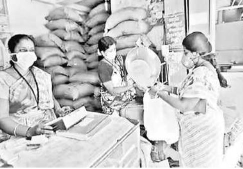
డీలర్లు పెట్టుకున్న పోర్టబిలిటీ రిక్వెస్ట్ అప్రూవల్ కు నోచుకోలేదు. ఈ నెల షాపులకు అదనపు బియ్యం రాక పోతే కార్డుదారుల నుంచి కనీసం రేషన్ సరుకులు తప్పిపోయాయి.

కాంగ్రెస్ ప్రభుత్వం వచ్చింది... కష్టాలు ప్రారంభమయ్యాయి... సామాన్య ప్రజలు కనీసం రేషన్ సరుకులు పొందేందుకు కూడా నోచుకోవడం లేదు. పౌర సరఫరాల పంపిణీ వ్యవస్థలో 'పోర్టబిలిటీ' విధానం అమల్లో ఉండడంతో అభిదారులు రాష్ట్రంలో ఎక్కడి నుండినా ప్రతి నెల రేషన్ పంపిణీలో తీసుకునే సౌకర్యం ఉంది. గత టీఆర్ఎస్ ప్రభుత్వంలో ఎన్నడూ సమస్య లేకపోవడంతో ప్రజలు ఈ సౌకర్యాన్ని సజావుగా ఉపయోగించుకున్నారు.