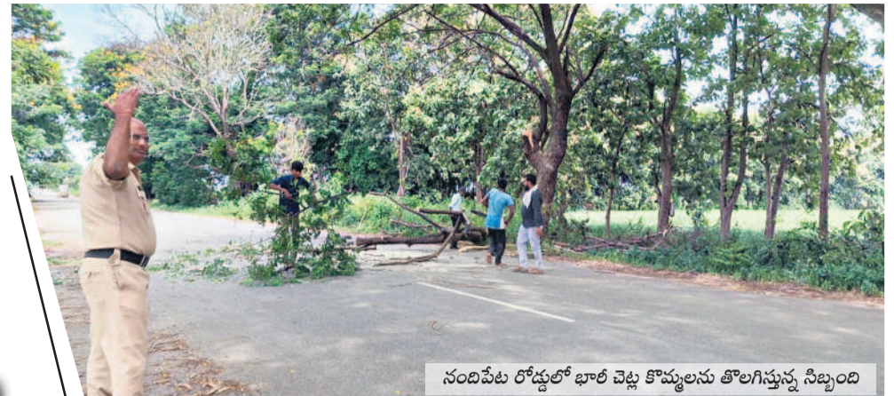
నందివేట రోడ్డులో భారీ వెళ్ల శివలింగాలను తోలగిస్తున్న సిబ్బంది

పర్యవేక్షిస్తున్న ఆయా శాఖల అధికారులు ఎనిమిది ఫీట్లలోపు విగ్రహాలు బాసరకు.. శోభాయాత్ర రూట్ మ్యాప్ ను విడుదల చేసిన సార్వజనిక్ గణేశ్ మండలి