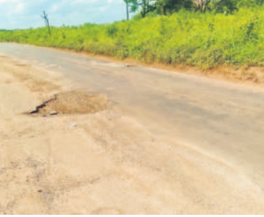
అధికారులు నిత్యం రద్దీగా ఉండే జిహారాబాద్-బీదర్ ఆర్ అండ్ బీ రోడ్డు మార్గం