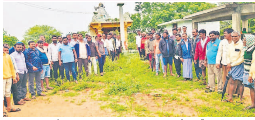
ఆలయం భూమి కోసం పోరాడుతున్న నాగపూర్ గ్రామం రెవెన్యూ పరిధిలోని శభాష్ గూడెం గ్రామస్థులు

చేరాల, సెప్టెంబర్ 15: దేవుళ్ల భూములకు రక్షణ లేకుండా పోతున్నది. దేవుడికి విరాళంగా ఇచ్చిన భూములు, దేవుడి పేరిట నమోదైన భూములను కొందరు రెవెన్యూ అధికారులు విరాళమిచ్చిన వారునులకు పట్టా చేసి దేవుడికి అన్యాయం చేస్తున్నారు. విరాళం ఇచ్చిన భూమి దేవుడి పేరిట ఉండాలని కొంతమందికి సద్దుమార్గం చూపాలని చాలా జిల్లా అధికారులు అప్రమత్తంగా ఉండాలని, పోలీసు అధికారులు, సిబ్బంది శాంతిభద్రతలను సమస్య తలెత్తకుండా చూసుకోవాలన్నారు. మంత్రి వెంట ముస్లింల పర్యవేక్షణను ముఖ్యంగా ఉంచాలని, వైస్ చైర్మన్లతో కలిసి నిమజ్జనం చేసే స్థలాలను పర్యవేక్షించాలని కోరారు. ఈ సందర్భంగా మంత్రి విలేజ్ లెవల్లో మూల్యాంకనం చేసి ఎల్లమ్మ చెరువు వద్ద నిమజ్జనం కోసం ఎలాంటి ఇబ్బందులు తల