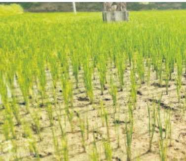
సిద్దిపేట జిల్లా మక్కమానాసానపల్లిలో నీళ్లు తరలి ఆరిపోతున్న వరి

గజ్వేల్, సెప్టెంబర్ 15: కాళేశ్వరం కాలువ పక్కన పొలాలున్న రైతులు మూడేండ్లగా వరి సాగు పంట పండించుకుంటున్నారు. ఈ ఏడాది కూడా రైతులు సుమారు 100 ఎకరాల వరకు కాలువ పక్కన భూముల్లో వరి సాగు చేశారు. కాలువలో ఉన్న కొద్దిపాటి గోదావరి జలాలతో నాలుగేండ్ల రైతులకు ప్రస్తుతం వరికి సాగు నీళ్లు అందించడం కష్టంగా మారింది. కాళేశ్వరం కాలువలోకి సాగు నీళ్లు వదలకపోవడంతో వరి పొలాలు తరచి ఎండిపోతున్నాయి. గజ్వేల్ మండలం మక్క మానాసానపల్లి రైతులు 80 ఎకరాలు, బంగారం కలపూర్ గ్రామ రైతులు 70 ఎకరాలలో వరి సాగు చేశారు. ఈ గ్రామాల మధుగా వెళ్లే రామాయంపేట కాలువలోకి వర్షం మండలం జిల్లాపూర్ వద్ద సాగునీళ్లు వదిలితేనే సాగు