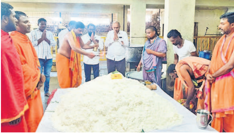
మహా అన్నదానం నిర్వహించే ముందు పూజలు చేస్తున్న కొమురవెల్లి శ్రీమల్లికార్జున స్వామి వారి ఆలయం ఈవో