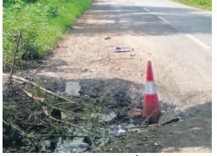
నారిజ వాగు సమీపంలోని జిహారాబాద్-బీదర్ రోడ్డు మార్గంలో ప్రమాదకరంగా మారిన గుంతలు