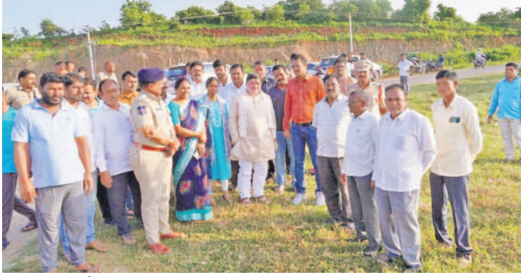
హుస్సాబాద్లోని ఎల్లమ్మ చెరువు వద్ద నిమజ్జన ఏర్పాట్లను పర్యవేక్షిస్తున్న మంత్రి పొన్నం ప్రభాకర్