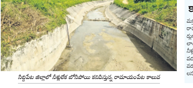
సిద్దిపేట జిల్లాలో నీళ్లు తరలి బోసిపోయి కనిపిస్తున్న రామాయంపేట కాలువ

చేసిన పంటలు చేతికొస్తాయి. మూడేండ్లగా రామాయంపేట కాలువలోని నీళ్లు అతరం పడి రైతులు వరిసాగు చేసే పంటలు పండి చేసిన వరిని బతికించుకునే అవకాశాలున్నా