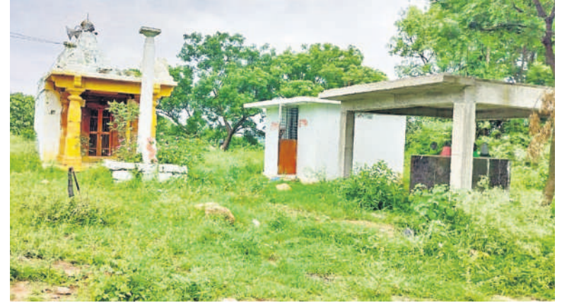
సిద్దిపేట జిల్లా నాగపూర్ గ్రామం రెవెన్యూ పరిధిలోని శభాష్ గూడెం వీరభద్ర స్వామి వారి ఆలయం