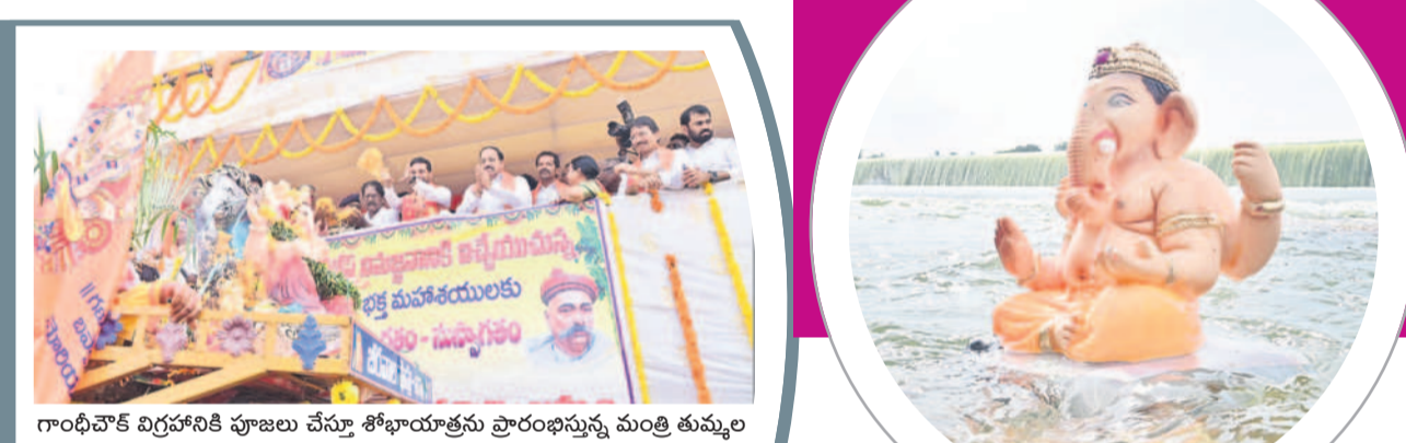
గాంధీవోక్ విగ్రహానికి పూజలు చేస్తూ శోభాయాత్రను ప్రారంభిస్తున్న మంత్రి తుమ్మల