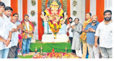
బర్మత్పురలో వినాయకుడి పూజల్లో శరత్శ్యామ్,కాలనీ వాసులు విద్భోలు పలుకుతున్న శ్రీ సాయి రెసిడెన్సీ మహి