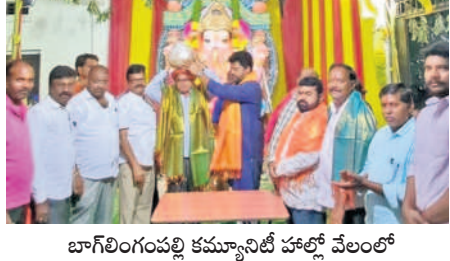
లడ్డూను రూ.57వేలకు దక్కించుకున్న లింగారెడ్డి