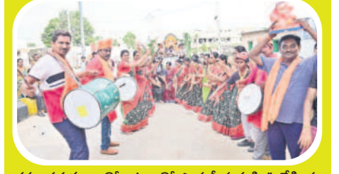
డప్పు దరువులు, కోలాటాలతో పార్కట్ పుత్రుడి ఊరేగింపు