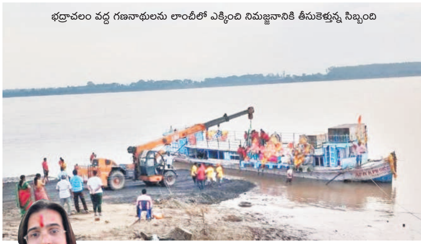
భద్రాచలం వద్ద గణనాథులను లాంచీలో ఎక్కించి నిమజ్జనానికి తీసుకెళ్తున్న సిబ్బంది