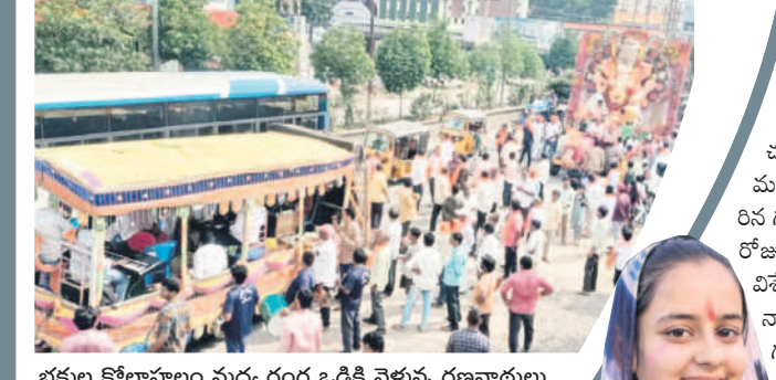
భక్తుల కోలాహలం మధ్య గంగ ఒడికి వెళ్తున్న గణనాథులు