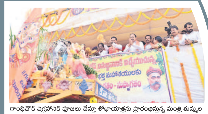
గాంధీవోక్ విగ్రహానికి పూజలు చేస్తూ శోభాయాత్రను ప్రారంభిస్తున్న మంత్రి తుమ్మల