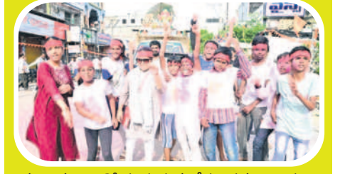
ఖమ్మం: నృత్యాలతో గణపయోచను తీసుకెళ్తున్న బిన్నారలు

ఖమ్మం, భద్రాద్రి జిల్లాల్లో ఈ నెల 7న వినాయక చవితి రోజున వెలాది మండపాల్లో కొమ్మిద్ది రిన గణపయ్య కొమ్మిద్ది రోజులపాటు భక్తుల విశేష పూజలందుకు న్నారు. సోమవారం గణనాథుల విగ్రహాలను భక్తకోటి సమీప జిల్లాలలో ఘనంగా నిమజ్జనం చేశారు. గణనాథుడి విగ్రహాలను మున్నేరు, పాలేరు రిజర్వాయర్, ఆకేరు, చెరువులు, వాగులు, కుంటల్లో నిమజ్జనం చేశారు. నేత్రవర్షం.. శోభాయాత్ర సంప్రదాయ వస్త్రధారణలతో నృత్యాలు.. విచిత్ర వేషధారణలు.. డప్పు నృత్యాలు కోలాహలంతో భక్తగణం గణనాథుడిని అనుసరించగా నిమజ్జన శోభాయాత్ర కనులందుకు వగా సాగింది. రకరకాల ఆకృతులలో గల భారీ, చిన్న వినాయక విగ్రహాలను బ్రాహ్మణ, వ్యాసలు, లారీలు తదితర వాహనాలపై ఖమ్మం నగరంలోని పలుచోట్ల నుంచి గాంధీవోక్ ప్రత్యేక వేదిక వద్దకు తీసుకొచ్చారు. అక్కడి నుంచి శోభాయాత్రా మున్నేరు ల్లిక్ష్మి వరకు తీసుకెళ్లారు. గణేశ్ శోభాయాత్ర వాహనాలు నడుపుతున్న డ్రైవర్లకు ట్రాఫిక్ పోలీసులు ట్రీట్ ఎనలైజర్ ద్వారా డ్రంకెన్ అండ్ డ్రైవ్ టెస్ట్ నిర్వహించారు.