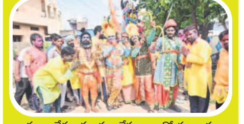
ఖమ్మం: దేవతామూర్తుల వేషధారణలతో కళాకారులు