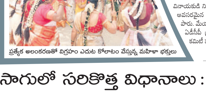
ప్రత్యేక అలంకరణతో విగ్రహం ఎదుట కోలాటం వేస్తున్న మహిళా భక్తులు