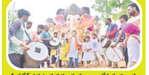
భారీ గణేశ్ ఎదుట దురువులకు నృత్యాలు చేస్తున్న బిన్నారలు