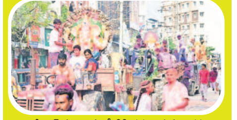
గాంధీవోక్ నుంచి మున్నేటికి కదులుతున్న విగ్రహాలు