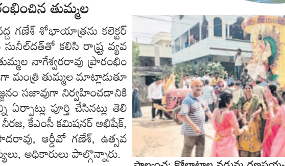
పాల్యం: కోలాటం నడుమ గణపయోచను సాగనంపుతున్న భక్తులు