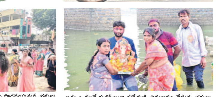
ఖమ్మం మున్నేరులో బుజ్జ గణేశుణ్ణి నిమజ్జనం చేస్తున్న భక్తులు