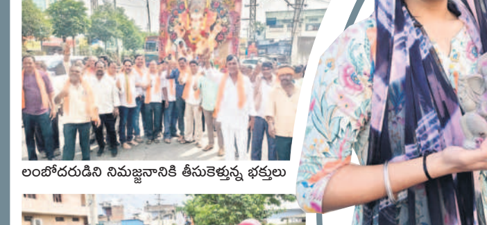
లంబోదరుడిని నిమజ్జనానికి తీసుకెళ్తున్న భక్తులు