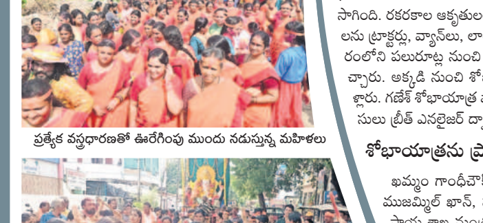
ప్రత్యేక వస్త్రధారణతో ఊరేగింపు ముందు నడుస్తున్న మహిళలు