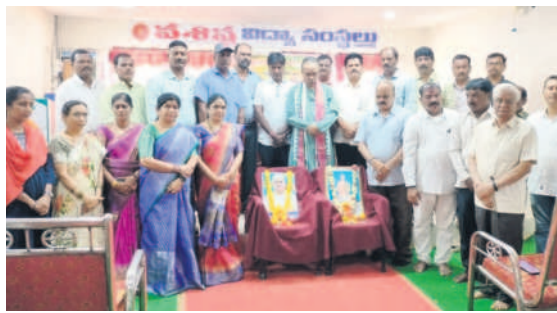
అయాచితం నటీకర్లచే నిర్వహించిన పద్య నివాసాలను ప్రకటించే కవులు, రచయితలు

కామారెడ్డి, సెప్టెంబర్ 16 : తెలంగాణ గర్వంచంద్ర మహాకవి అయాచితం నటీకర్ల కవులకు తీరని లోటు అని కామారెడ్డి కవులు అభిప్రాయపడ్డారు. కామారెడ్డిలోని వశిష్ట డిగ్రీ కళాశాలలో ఇటీవల స్వచ్ఛంద ప్రయత్నం కవి, రచయిత అయాచితం ద్వారా అయాచితం నటీకర్ల కవులకు తీరని లోటు అని కామారెడ్డి కవులు అభిప్రాయపడ్డారు. కామారెడ్డిలోని వశిష్ట డిగ్రీ కళాశాలలో ఇటీవల స్వచ్ఛంద ప్రయత్నం కవి, రచయిత అయాచితం ద్వారా అయాచితం నటీకర్ల కవులకు తీరని లోటు అని కామారెడ్డి కవులు అభిప్రాయపడ్డారు. కామారెడ్డిలోని వశిష్ట డిగ్రీ కళాశాలలో ఇటీవల స్వచ్ఛంద ప్రయత్నం కవి, రచయిత అయాచితం ద్వారా అయాచితం నటీకర్ల కవులకు తీరని లోటు అని కామారెడ్డి కవులు అభిప్రాయపడ్డారు.