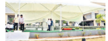
సమీకృత కార్యాలయంలో ఏర్పాట్లు చేస్తున్న సిబ్బంది

కామారెడ్డి, సెప్టెంబర్ 16 : రాష్ట్ర ప్రభుత్వం నిర్వహించే తలపెట్టిన ప్రజాపాలన దినోత్సవానికి సమీకృత జిల్లా కార్యాలయాల భవన సముదాయం ముస్తాబైంది. మంగళవారం నిర్వహిస్తున్న ప్రజాపాలన దినోత్సవ వేడుకల కోసం అధికార యంత్రాంగం అన్ని ఏర్పాట్లు పూర్తి చేసింది. తెలంగాణ టూరిజం డెవలప్‌మెంట్ కార్పొరేషన్ వైర్లెస్ పబ్లిక్ రమోకెడ్జి ముఖ్య అతిథిగా వచ్చి శ్రీవర్ణ పతాకాన్ని అవిష్కరించి పోలీసు గౌరవ వందనం స్వీకరించిన అనంతరం జిల్లా ప్రజలను ఉద్దేశించి ప్రసంగించనున్నారు. ఎలాంటి పొరపాట్లూ లేకుండా పక్కంటిగా ఏర్పాటు చేశారు.