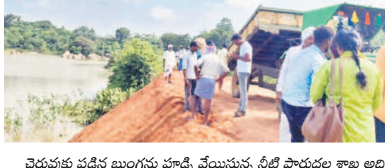
చెరువుకు వడిన బుంగను పూడ్చి వేయిస్తున్న నీటి పారుదల శాఖ అధికారులు