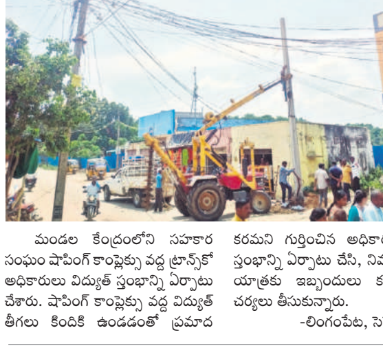
మండల కేంద్రంలోని సహకార కరమని గుర్తించిన అధికారులు కొత్త స్తంభాన్ని ఏర్పాటు చేసి, నిమజ్జన శోభాయాత్రకు ఇబ్బందులు కలుగుకుండా చేశారు. షాపింగ్ కాంప్లెక్స్ వద్ద విద్యుత్ తీగలు కిందికి ఉండడంతో ప్రమాద