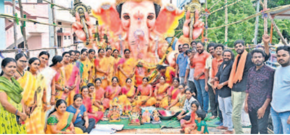
నల్లగొండలోని వినాయక బింపుల్ వద్ద శోభాయాత్రలో పాల్గొన్న భక్తులు