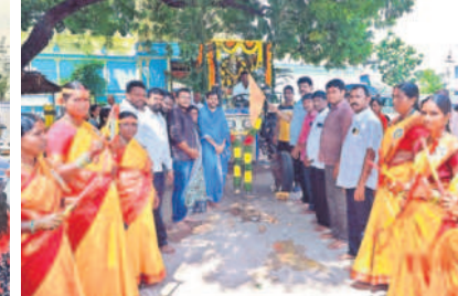
నార్యపల్లి : గణనాథుడిని నిమజ్జనం కోసం ఊరేగింపుగా తీసుకెళ్తున్న దేవాలయ నిధిబంది