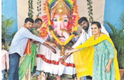
నిడమరూరు : పార్వతీపురంలో గణేశ్ మండపం వద్ద పూజల్లో పాల్గొన్న ముస్లిం దంపతులు