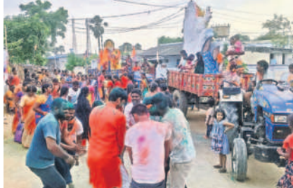
కట్టంగూర్ మండలం ముసుకుంట్లలో వినాయక నిమజ్జనంలో కోలాటం వేస్తున్న భక్తులు