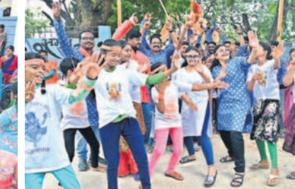
నల్లగొండ రవీంద్రనగర్లో నిమజ్జనంలో భాగంగా యువతులు, కాలనీవాసుల సృత్యాలు