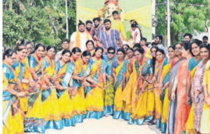
జిల్లా కేంద్రంలోని వీటి కాలనీలో శోభాయాత్రలో భాగంగా కోలాటం వేస్తున్న మహిళలు