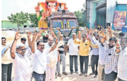
నల్లగొండలోని శాంతినగర్లో భారీ గణనాథుడిని నిమజ్జనానికి తరలిస్తున్న ఉత్సవ కమిటీ సభ్యులు