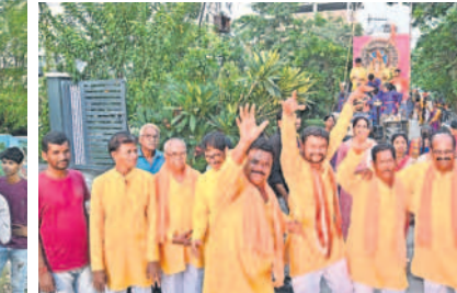
నల్లగొండలోని విద్వానగర్ కాలనీలో వినాయక నిమజ్జన శోభాయాత్రలో పాల్గొన్న స్థానికులు