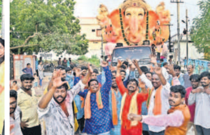
నల్లగొండలోని శ్రీనగర్ కాలనీలో విగ్రహాన్ని నిమజ్జనానికి తరలిస్తున్న కాలనీవాసులు