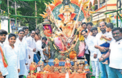
నల్లగొండలోని డాక్టర్ కాలనీలో వినాయక విగ్రహాన్ని నిమజ్జనానికి తీసుకెళ్తున్న కాలనీవాసులు