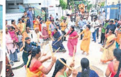
నల్లగొండలోని వైతన్యపురి కాలనీలో కోలాటం వేస్తున్న మహిళలు