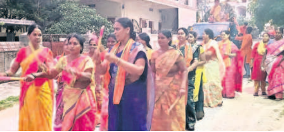
నల్లగొండ : సూర్య తిరుమలనగర్లో గణేశ్ శోభాయాత్రలో పాల్గొన్న మహిళలు