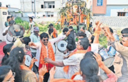
నల్లగొండలోని రాకెట్ పోల్ కాలనీలో సృత్యం వేస్తున్న ఉత్సవ కమిటీ సభ్యులు, కాలనీవాసులు