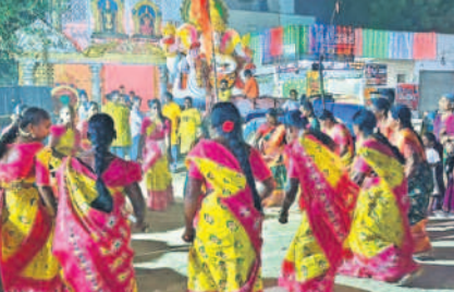
చందూరు : మండల కేంద్రంలో వినాయక నిమజ్జనంలో కోలాటం ఆడుతున్న మహిళలు