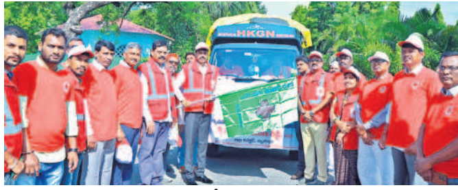
వరద బాధితులకు నిత్యావసరాలతో కూడిన వాహనాన్ని ప్రారంభిస్తున్న కలెక్టర్