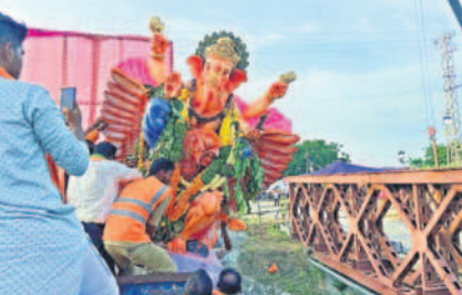
అనుముల మండలం అలినగర్ వద్ద సాగర్ ఎడమ కాల్వలో విగ్రహాలను నిమజ్జనం చేస్తున్న సిబ్బంది