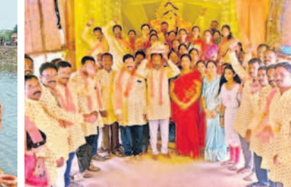
నల్లగొండలోని సూర్యవంశీ కాలనీలో ప్రత్యేక పూజల్లో పాల్గొన్న కాలనీవాసులు