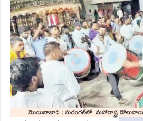
మొయినాబాద్ : సురంగల్లో మహారాష్ట్ర డోలవాయిద్యాలతో నిమజ్జన ర్యాలీ

సంగమ వినియోగ నిమజ్జనాలు భారీగా పలికి లక్షల వేలం పాటలు రంగారెడ్డి జిల్లావ్యాప్తంగా పలు చోట్ల వినియోగ నిమజ్జన కార్యక్రమాన్ని సుసంగా నిర్వహించారు. తొమ్మిది రోజులపాటు విశేష పూజలను ద్వారా తనయుడు గణపయ్య భారీ ఊరేగింపు మధ్య గంగమ్మ ఒడికి చేశారు. ఈ సందర్భంగా బ్యాంకు వాయిద్యాలు, యువత నృత్యాలు, మహిళా కోలాట ప్రదర్శనలు ప్రత్యేక ఆకర్షణగా నిలిచాయి.