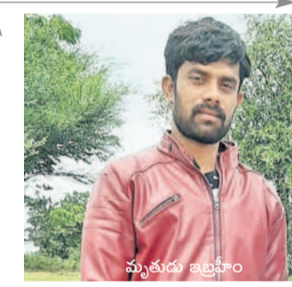
చేకడ్యామ్లో నీటి మునిగి యువకుడు మృతి