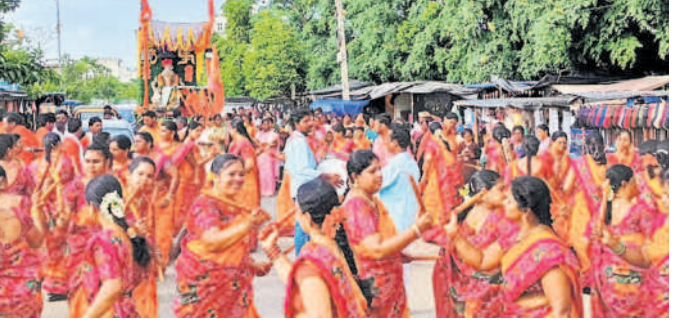
గజ్వేల్ లో గణేశోపాసన

సిద్దిపేట జిల్లా నెట్వర్క్, నవస్వ తెలంగాణ, సెప్టెంబర్ 16