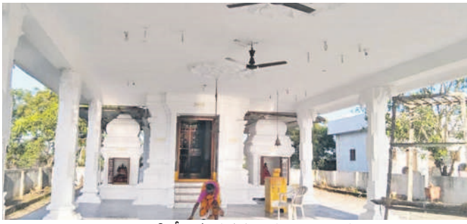
ఎల్లంటిలో అనంత పద్మనాభస్వామి ఆలయం