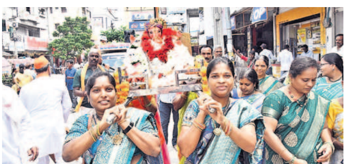
సిద్దిపేట లో: గణపయ్యను పల్లకిలో నిమజ్జనానికి తరలిస్తున్న నిర్వాహకులు