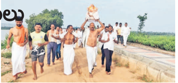
హుస్సేనాబాద్ లో: ఆలోగణపతిని ఊరేగించుగా తీసుకువెళ్తున్న ఎంఎండి సభ్యులు