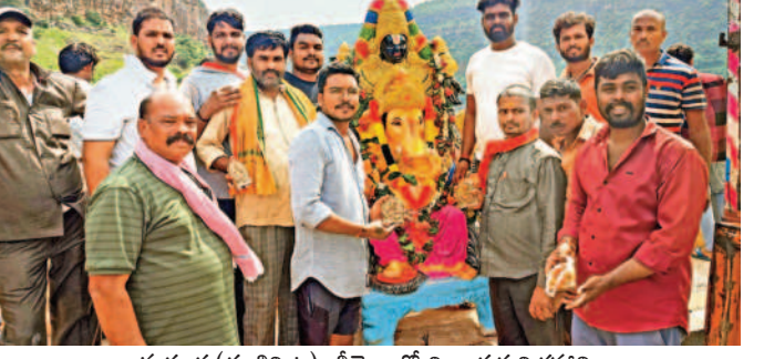
మద్దూరు (హుస్సేనాబాద్): శ్రీశైలంలో వినాయక విగ్రహాన్ని నిమజ్జనం చేస్తున్న లద్దూర్ గ్రామస్థులు