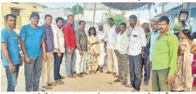
మిరుదొడ్డిలో మల్లయ్య కుటుంబానికి ఆర్థికసాయం అందజేస్తున్న టీవర్షు

మిరుదొడ్డి, సెప్టెంబర్ 16 : ఇటీవల మిరుదొడ్డి టౌన్ లో వివిధ కారణాలతో ఇద్దరు మృతులు మృతి చెందారు. సోమవారం మిరుదొడ్డి టౌన్ కు చెందిన టీవర్షు అసోసియేషన్ ఆధ్వర్యంలో ఉపాధ్యాయులు మృతుల కుటుంబాలను పరామర్శించి బోయిని నాగ