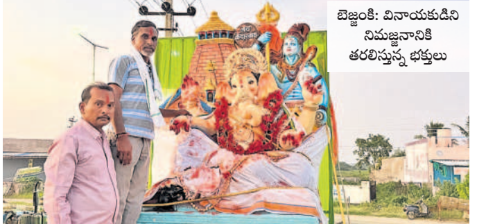
బెజ్జంకి: వినాయకుడిని నిమజ్జనానికి తరలిస్తున్న భక్తులు