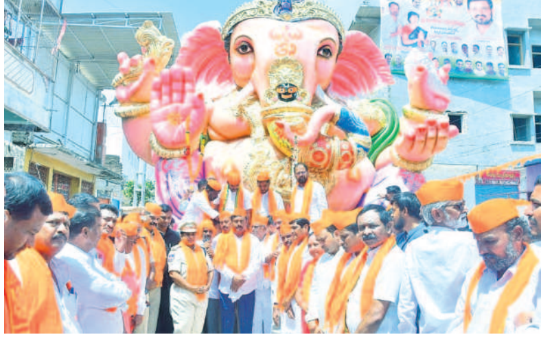
నిర్మల్ లో: శోభాయాత్రను ప్రారంభించిన ఎమ్మెల్యేలతో సహా పాల్గొన్న అధికారులు