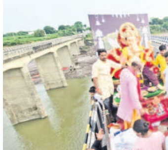
పెన్ గంగాలో నిమజ్జనం చేస్తున్న ఆదిలాబాద్ గుజరాతి సమాజ సభ్యులు