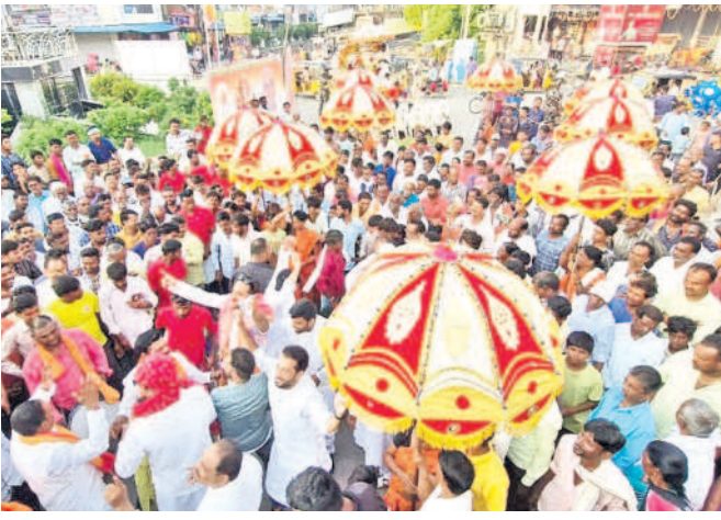
ఆదిలాబాద్ లో గణేశ నిమజ్జనానికి శోభాయాత్రగా వెళ్లిన భక్తులు