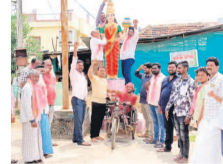
హుజూరాబాద్ రూరల్ : పెద్దపాపయ్యపల్లిలో తెలంగాణ తల్లి విగ్రహానికి పాలాభిషేకం చేస్తున్న బీఆర్ఎస్ నాయకులు