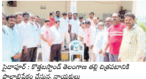
సైదాపూర్ : కొత్తబస్టాండ్ తెలంగాణ తల్లి విగ్రహానికి పాలాభిషేకం చేస్తున్న నాయకులు

- కరీంనగర్, సెప్టెంబర్ 17 (నమస్తే తెలంగాణ)