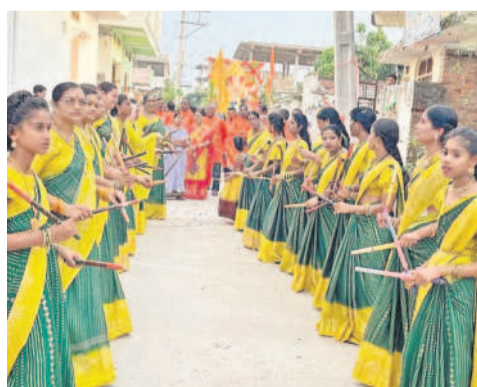
సిరిసిల్ల రూరల్ : తంగళ్లపల్లిలో శోభయాత్రలో కోలాటాలు అడుతున్న మహిళలు