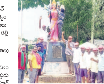
మల్లారా: తెలంగాణ తల్లి విగ్రహానికి పాలాభిషేకం చేస్తున్న బీఆర్ఎస్ నాయకులు