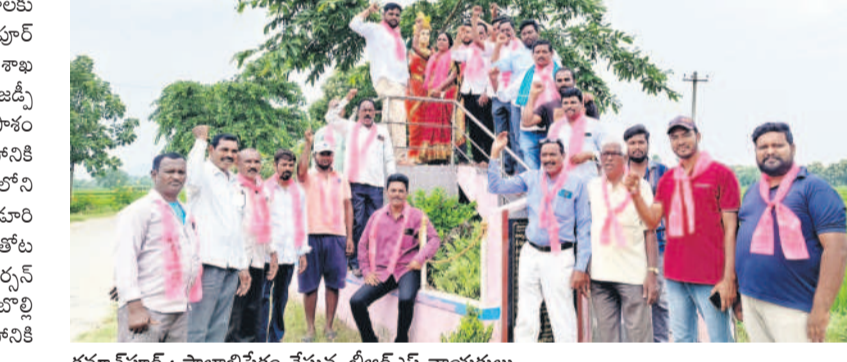
కమాన్ పూర్ : పాలాభిషేకం చేస్తున్న బీఆర్ఎస్ నాయకులు