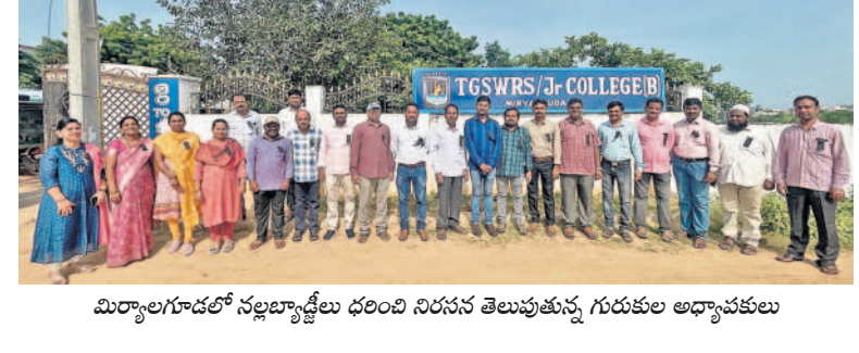
మిర్జాపూర్లో నల్లబాట్ల దళిది నిరసన తెలుపుతున్న గురుకుల అధ్యాపకులు

బాబీ బాంబేకు 130 కోట్ల విరాళం బెంగళూరు, సెప్టెంబర్ 17: మోతీలాల్ ఓస్వాల్ ఫౌండేషన్ బాబీ బాంబేకు మంగళవారం రూ.130 కోట్ల విరాళాన్ని ప్రకటించింది. ఆర్థిక రంగ వృద్ధికి తోడ్పడే విధంగా మోతీలాల్ ఓస్వాల్ ఫౌండేషన్ ఫర్ క్యాపిటల్ మార్కెట్ను క్యాంపస్లో క్యాంపస్లో నెలకొల్పాలన్నాడు. ఆ కడమిక్ ప్రోగ్రాములను ఆపర్ చేయాలని ప్రణాళికలు రచిస్తున్నది.