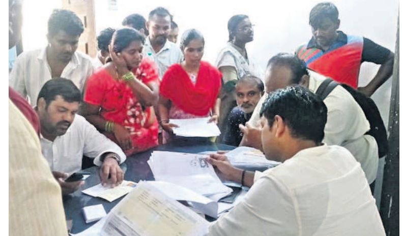
ఖమ్మం రూరల్ మండల ఆర్డీ ఎదుట మొరపెట్టుకుంటున్న వరద బాధితుల ఆందోళన

అధికారులు కండ్లారా చూశారు మా ఇల్లు మునిగిన విషయాన్ని అధికారులు కండ్లారా చూశారు. సర్కారు సాయం చేసే జాబితాలో మా పేరు లేదు. వరద తగ్గిన తరువాత ఒక్కొక్కరు అధికారులు వచ్చారు. వివరాలన్నీ మా ఇంటి దగ్గరే నమోదు చేసుకున్నారు. కానీ మాకు పరిహారం రాలేదు. సర్కారు సాయం రూ.5 వేలు అందిస్తే సాధికారం లేదని మాకు అది కూడా రాలేదు.