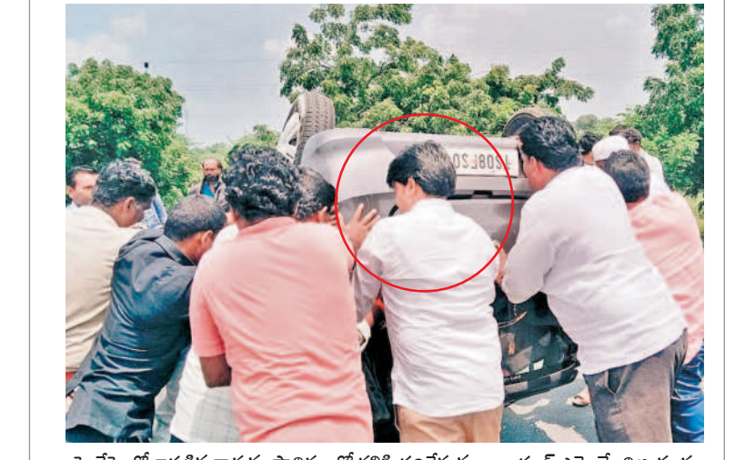
హైదరాబాద్ బోర్డర్లలోని కారును స్టాంపులతో కలిపి సలహాపై అలంకారం ఎమ్మెల్యే విజయం

ఫార్మా రద్దుతోనే తొలి అడుగు పడింది. రిజిస్ట్రార్ రిజిస్ట్రార్ అల్లెనీమెంట్ మార్పుతో అసలు కథ మొదలైంది. గత బీఆర్ఎస్ ప్రభుత్వం దాదాపు 19వేల ఎకరాల భూసేకరణ పూర్తిచేసి ఫార్మాసిటీ