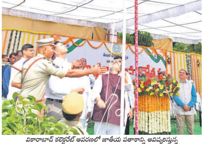
వికారాబాద్ కలెక్టరేట్ ఆవరణలో జాతీయ పతాకాన్ని అవిష్కరిస్తున్న స్వీకర్ గడ్డం ప్రసాద్ కుమార్

సిద్ధించిన తెలంగాణ.. తెలంగాణ ప్రజాపాలన దినోత్సవంలో స్వీకర్ గడ్డం ప్రసాద్ కుమార్, సీఎం సలహాదారు వేం నరేందర్ రెడ్డి