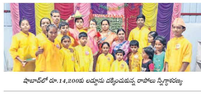
షాబాద్లో రూ.14,200కు అడ్వాన్స్ దక్కించుకున్న రాఫాలే స్పృశకరణ