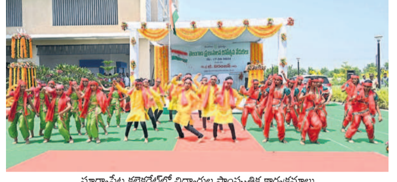
సూర్యాపేట కలెక్టరేట్లో విద్యార్థుల సాంస్కృతిక కార్యక్రమాలు