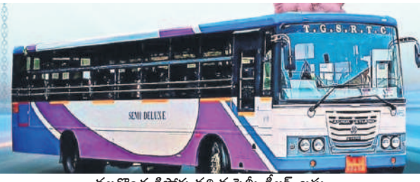
నల్లగొండ డిపోకు వచ్చిన సెమీ డీలక్స్ బస్సు