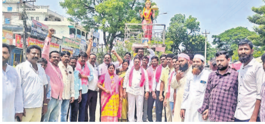
కోదాడ పట్టణంలో తెలంగాణ తల్లి విగ్రహం ఎదుట నిరసన తెలుపుతున్న బీఆర్ఎస్ నాయకులు

జనుల సమ్మతి, బండ్లు, రాస్తారోకోతో తెలంగాణ రాష్ట్రం ఆవిర్భవించిందని తెలిపారు. ప్రజా పాలనతో ప్రజల వద్దకు.. ముఖ్యమంత్రి రేవంత్ రెడ్డి సారథ్యంలో ప్రజా పాలనతో ప్రజల వద్దకు పాలన చేరవ చేస్తున్నట్లు బీసీ కమిషన్ చైర్మన్ నిరంజన్ పేర్కొన్నారు. ఆరు గ్యాంగ్ లో అమలులో భాగంగా ఇప్పటి వరకు రాష్ట్రంలో 87.12 కోట్ల మంది మహిళలు ఉచిత బస్సు ప్రయాణం చేసినట్లు చెప్పారు. ఈ పథకం ద్వారా సూర్యాపేట జిల్లాలో 2 కోట్ల 36 లక్షల 64 వేల మంది మహిళలు ఉచిత ప్రయాణం చేశారని తెలిపారు. ఆరోగ్యశ్రీ పథకాన్ని రూ.10లక్షలకు పెంచడంతో జిల్లాలో 21,295 మంది పేదలు చికిత్స పొందారన్నారు. రూ.500 వంట సిలిండర్ పథకంలో భాగంగా జిల్లాలో 1.48 లక్షల మందికి లబ్ధి చేశారని, ఇప్పటివరకు రూ. 8.24 కోట్లను సమీక్షి అందించడం జరిగిందని పేర్కొన్నారు. 200 యూనిట్ల ఉచిత విద్యుత్ పథకం ద్వారా జిల్లాలో 1,69,326 మంది లబ్ధి పొందుతున్నారని పేర్కొన్నారు. రుణమాఫీలో భాగంగా రూ.545 మంది రైతుల ఖాతాలో రూ.888.69 కోట్లను ప్రభుత్వం జమ చేసినట్లు చెప్పారు. రైతు భరోసా విధి ద్వారా త్వరలోనే ప్రకటించి అమలు చేయనున్నట్లు తెలిపారు. సన్న పప్పు పండించే ప్రతి రైతుకు క్షీరపానం రూ.500 బోనస్ ఈ వాస కాండ్ల నుంచి అందించనున్నట్లు పేర్కొన్నారు. అమ్మ అలలు సంరక్షించారు. సమాచార పాఠ సంబంధాల శాఖ ఏర్పాటు చేసిన ఫోటో ఎగ్జిబిషన్ నిరంజన్ ప్రారంభించి అభినందనలు తెలిపారు. అంతకు ముందు కలెక్టర్ తేజస్ నందలాల్ హరణ్, ఎస్సీ సనీప్రీత్ సింగ్ పోలీసుల గౌరవ పంపనం స్వీకరించి అమరులకు నివాళులర్పించారు. కార్యక్రమంలో అదనపు కలెక్టర్ బీఎన్ లక్ష్మి, అదనపు ఎస్సీ సాగర్ శర్మ, జిల్లా సీఈఓ అప్పారావు, డిఎస్ఎస్ సతీశ్ కుమార్, జిల్లా అధికారులు పాల్గొన్నారు.