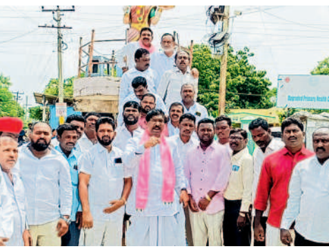
స్నేహపూర్వీకార్ లో నిరసనలో పాల్గొన్న మాజీ ఎమ్మెల్యే రాజమండ్రి