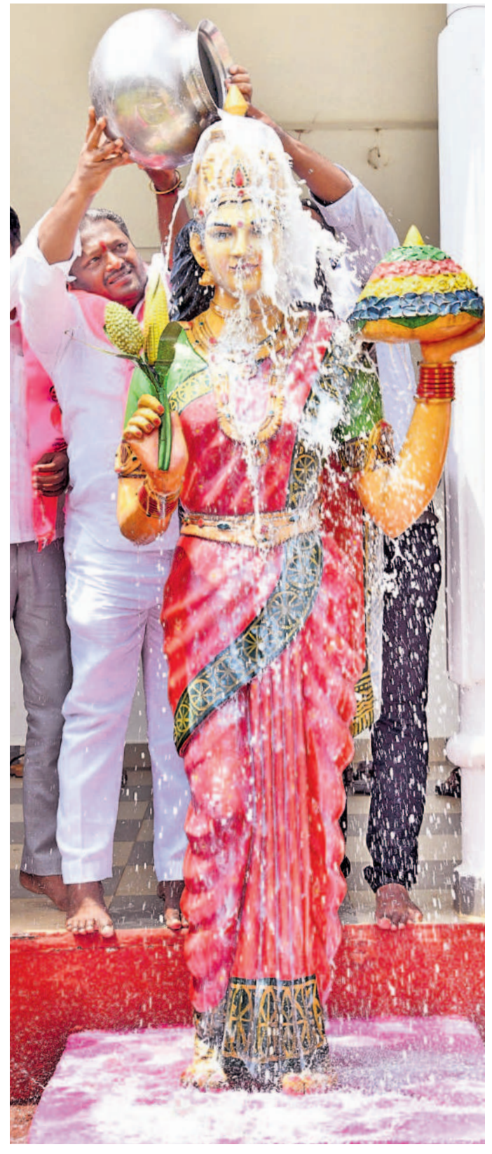
హనుమకొండ బీఆర్ఎస్ కార్యాలయంలో తెలంగాణ తల్లికి పాలాభిషేకం చేస్తున్న బీఆర్ఎస్ నేత పులి రజనీకాంత్