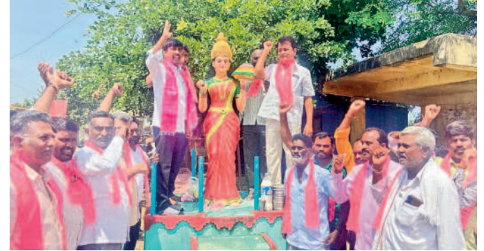
పాలకూరు: దర్శనల్లో తెలంగాణ తల్లి విగ్రహానికి పాలాభిషేకం చేస్తున్న గులాబీ శ్రేణులు