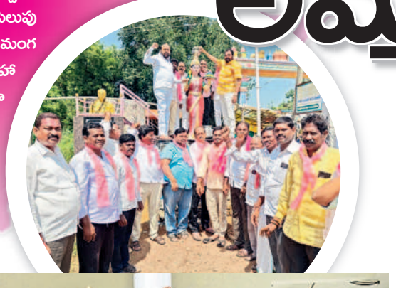
రాయపల్లె: శివరామపురంలో తెలంగాణ తల్లి విగ్రహానికి పాలాభిషేకం చేస్తున్న బీఆర్ఎస్ నేతలు

సీఎం రేవంకర్ రెడ్డి ప్రభుత్వ తీరుపై బీఆర్ఎస్ నేతలు, తెలంగాణ వాదులు భగ్గుమన్నారు. రాష్ట్ర సచివాలయం, అమర జ్యోతి మధ్యలో తెలంగాణకు సంబంధం లేని రాజకీయాంధ్ర విగ్రహం ఏర్పాటు చేశారని మండిపడ్డారు. బీఆర్ఎస్ మేల్కొంగ్గే పైని డెండ్ కేటీఆర్ పిలుపు వేరకు ఉమ్మడి వరంగల్ లో మంగళ వారం తెలంగాణ తల్లి విగ్రహానికి పూజలమాలలు వేసి పాలాభిషేకాలు నిర్వహించారు.