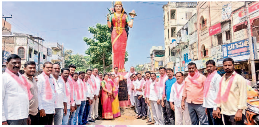
నర్సంపేటలో తెలంగాణ తల్లి విగ్రహం ఎదుట నిరసన తెలుపుతున్న బీఆర్ఎస్ నాయకులు