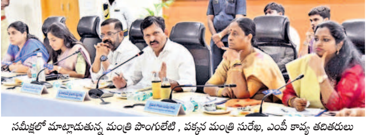
సమీక్షలో మాట్లాడుతున్న మంత్రి పొంగులేటి, పక్కన మంత్రి సురేష్, ఎంపీ కావ్య తదితరులు