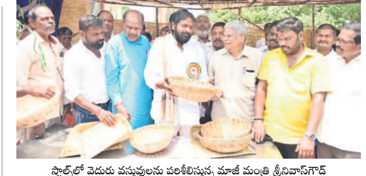
స్టాఫ్లో వెదురు వస్తువులను పరిశీలిస్తున్న మాజీ మంత్రి శ్రీనివాస్ గౌడ్

అర్హులైన రైతులందరికీ రుణమాఫీ వర్తించేయాలనే లక్ష్యంతో ప్రభుత్వం రైతు కుటుంబాల నిర్ధారణ కార్యక్రమాన్ని చేపట్టింది. ఏడేవిలు, ఏవో, ఏకావో గ్రామ స్థాయిలో సమావేశాలు నిర్వహించి సేకరించిన సమాచారాన్ని ప్రత్యేక యూజిలో సమారు చేస్తున్నారు. సమయానికి అధికారులే తని రైతులు కార్యాలయానికి వచ్చి వివరాలు తెలియజేసినా అవకాశం కల్పించారు. ఇతర ప్రాంతాలు, విదేశాల్లో ఉన్న వారి వివరాల సమారు కొంత ఇబ్బందిగా మారింది. పెండింగ్లో ఉన్న రైతుల వివరాల సమారును త్వరలోనే పూర్తి చేయాలని..