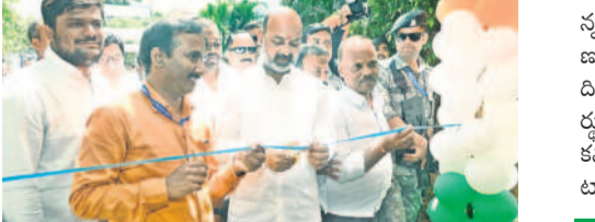
ల్యాండ్ ప్రారంభోత్సవ కేంద్ర హోంశాఖ సహాయ మంత్రి బండి సంజయ్ కుమార్

కలింగగర్ విద్యార్థులకు, సెప్టెంబర్ 18: కలింగగర్ ఐటీఐ కళాశాలలో చదివే విద్యార్థులకు ఉద్యోగ, ఉపాధి అవకాశాలు కల్పిస్తామని కేంద్ర హోంశాఖ సహాయ మంత్రి బండి సంజయ్ కుమార్ పేర్కొన్నారు. ప్రధాని నరేంద్ర మోడీ ఐటీఐ నేపథ్యంలో 'సేవా పక్కా' పక్కా పాల్లో భాగంగా రాష్ట్రంలో తొలిసారిగా కలింగగర్ ఐటీఐ కళాశాలలో పైలెట్ ప్రాజెక్టు కింద ఏఆర్, వీఆర్ (ఆగ్ మెంట్) రియాలిటీ, వీడియో చర్చులలో రియాలిటీ ప్రాజెక్టు ప్రారంభించారు. ఆనంతరం విద్యా ర్థులనుద్దేశించి ప్రసంగించారు. ఇది పైలెట్ ప్రాజెక్టు