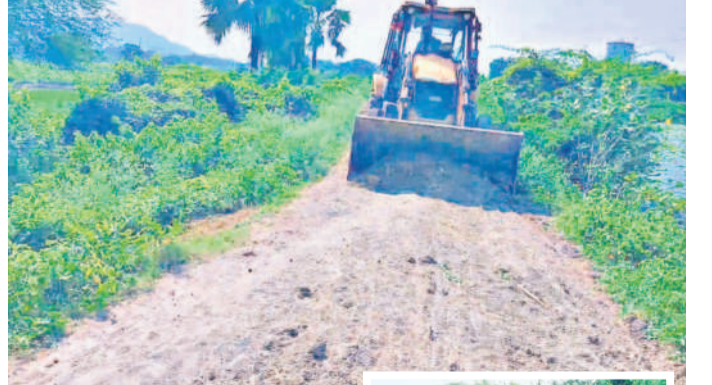
కరకట్ట రోడ్డును చదును చేస్తున్న ఎన్టీకడపల్

కమాన్వూర్, సెప్టెంబర్ 18 : ఇటీవల కురిసిన వర్షాలతో కమాన్వూర్ మండలం జూలపల్లి గ్రామ పెద్ద చెరువు కట్టపై రోడ్డు అడ్డా సంగం మారింది. మోకాలి లోకంలో బురద ముయ్యింది. ఈ రోడ్డు గుండా వెళ్లించుకు రైతులు, కూలీలు నానా అవస్థలనున్నారు. ఈ క్రమంలో 'జూలపల్లి కరకట్టపై నడక నడక' శిబిరం ఈ నెల 12న 'సమస్తి తెలంగాణ'లో కథనం ప్రచురించారు. అయినా అధికారులు, ప్రజాప్రతినిధులు తమకేమీ పట్టకట్టగా వ్యవహరించారు. ఇకలాభం లేదనుకొని రైతులే రోడ్డుకు మరమ్మతులు చేసే