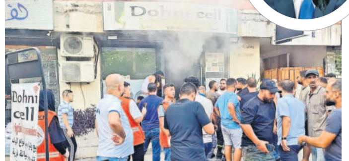
లెబనాన్లో వాకిటాటూల పీలాయని భావించిన ఓ మొబైల్స్ దుకాణం ముందు గుమికూడిన స్థానికులు

ఇజ్రాయేల్ భూభాగంలో ఏ ప్రాంతంపైనైనా గత ఏడాది ఆక్టోబరు 8 నుంచి హెజ్కోల్లా, ఇజ్రాయేల్ మధ్య దాడులు, ప్రతిదాడులు జరుగుతున్నప్పటికీ ఇరుప్రక్కలు పూర్తిస్థాయి యుద్ధానికి దిగలేదు. ఏడాదిగా ఇప్పటివరకు ఇజ్రాయేల్ దాడుల్లో లెబనాన్లో 500 మందికి పైగా మరణించారు. హెజ్కోల్లా దాడుల్లో 23 మంది ఇజ్రాయేల్ సైనికులు, 26 మంది ప్రజలు మరణించారు. కాగా, 2016లోనూ ఇజ్రాయేల్, హెజ్కోల్లా మధ్య 37 రోజుల పాటు జరిగిన యుద్ధంలో హెజ్కోల్లా తీవ్రంగా నష్టపోయింది. అయితే, 2008లోనూ హెజ్కోల్లా కూడా యుద్ధ సామర్థ్యాలను వెంచుకుందనే అభిప్రాయం దగ్గర ఉన్నాయి. ప్రస్తుతం హెజ్కోల్లా దగ్గర 1,50,000 రాకెట్లు, క్షేపణులు ఉన్నాయని,