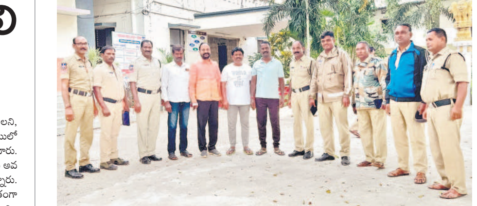
కామారెడ్డిలో బీఆర్ఎస్ నాయకులను అరెస్టు చేసి రాజాకు తరలించిన పోలీసులు

నమస్తే తెలంగాణ యంత్రాంగం, సెప్టెంబర్ 19 : జిల్లాలో అక్రమ అరెస్టుల పర్వం కొనసాగుతున్నది. 'ముందస్తు' పేరిట బీఆర్ఎస్ నేతలను పోలీసు శాఖ అదుపులోకి తీసుకుంటున్నది. తాళాకు గురువారం అవకాశం వచ్చినప్పుడు పట్టుకుని తరలించారు. ఇంటికి ఉన్న వారిని, పని మీద బయటకు వెళ్లిన పట్టుకుని పోలీసుస్టేషన్లో నిర్బంధించారు. అసెంబ్లీ ఎన్నికల వేళ కాంగ్రెస్ పార్టీ ఇచ్చిన