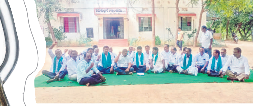
నందిపేట్ మండలకేంద్రంలో ధర్నాచేస్తున్న బిక్యకార్యాలపరణ కమిటీ ప్రతినిధులు, రైతులు

నమస్తే తెలంగాణ యంత్రాంగం, సెప్టెంబర్ 19: రూ.2 లక్షల రుణ మాఫీ కోసం ఉద్యమాన్ని ప్రారంభించిన రైతులు ఆందోళనలు కొనసాగిస్తున్నారు. ఆర్మూర్ డివిజన్లోని అన్ని తహసీల్ కార్యాలయాల ఎదుట గురువారం బైరాయింపులు జరిపారు. ఆర్మూర్, మాక్లూర్, నందిపేట్, అలూర్, మార్కాడ్, వేల్పూర్, జిల్లాపల్లి తదితర మండలాల్లోని తహసీల్ ఆఫీసుల ఎదుట ధర్నా చేపట్టారు. మాట ఇచ్చి మోసం చేసిన కాంగ్రెస్ పార్టీకి వ్యతిరేకంగా నినాదాలు చేశారు. కాంగ్రెస్ పార్టీ చెప్పినట్లు రూ.2 లక్షల రుణమాఫీ చేయాలని రైతు బిక్యకార్యాలపరణ కమిటీ ప్రతినిధులు డిమాండ్ చేశారు. మామూలులు చెప్పి అధికారంలోకి వచ్చిన కాంగ్రెస్ రైతులను మోసం చేసింది