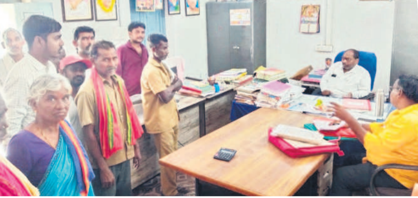
కమ్యూనిటీ వేతనాలు ఇవ్వాలని కోరుతున్న పాలకుల కార్యకర్తలు