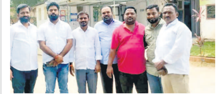
మేములవాడ పోలీస్ స్టేషన్లో టీఆర్ఎస్ నాయకులు

5 కరీంనగర్, శుక్రవారం 20 సెప్టెంబర్ 2024 KARIMNAGAR