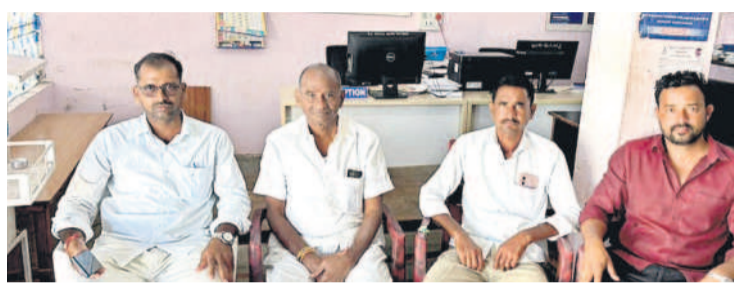
దుర్రంగి పోలీస్ స్టేషన్లో టీఆర్ఎస్ నాయకులు

ప్రజా ఉద్యమంపై నిరంధంబం మోపుతున్నారు. రైతులకు మద్దతిచ్చిన టీఆర్ఎస్ నాయకులను ముందస్తుగా అరెస్టు చేశారు. రుణమాఫీ కాని రైతుల పిలుపు మేరకు ‘ఫలో ప్రజా భవన్’ ధర్నాకు వెళ్లకుండా నేతలను గురువారం ఉదయమే అదుపు లోకి తీసుకుని, స్టేషన్లకు తరలించారు. ఉమ్మడి కరీంనగర్ జిల్లా నుంచి తరలి వెళ్తున్న వారిని ఎక్కడిక్కడ అదుకోవడంతో టీఆర్ఎస్ నాయకులు ఆగ్రహం వ్యక్తం చేశారు. ఇలాంటి అక్రమ అరెస్టులతో రైతుల ఉద్యమంను ఆపలేరని, రైతుల సమస్యలను పరిష్కారం అయ్యేంత వరకు ఉద్యమిస్తామని హెచ్చరించారు.