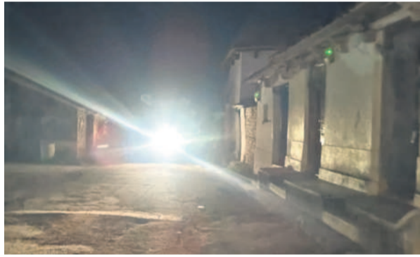
కోనరావుపేటలో రాత్రి పూట కరెంటు లేక అంధకారంలో ఓ వీధి