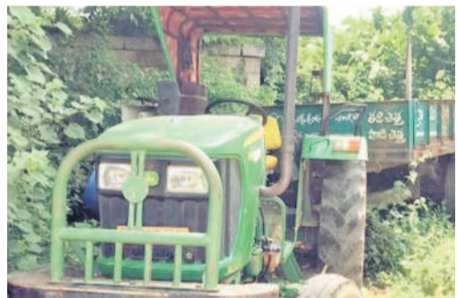
డీజిల్ లోక మూలన ఉన్న ట్రాక్టర్

‘ప్రత్యేక’ పాలనలో పల్లెల్లో అభివృద్ధి కుంటుపడుతున్నది. పెండింగ్ బిల్లులు చెల్లించకపోవడంతో ప్రజలు నిత్యం సరకం అనుభవిస్తున్నారని వస్తున్నది. వీధి లైట్లు వెలగపోవడంతో ట్రాక్టర్లను ముగ్గుల్ని వస్తున్నది. డీజిల్ లోక ట్రాక్టర్లు నడవకపోవడంతో ఎక్కడి చెత్త అక్కడే పేరుకుపోతున్నది. అందుకు కోనరావుపేట మండలకేంద్రమే నిదర్శనంగా నిలుస్తున్నది.