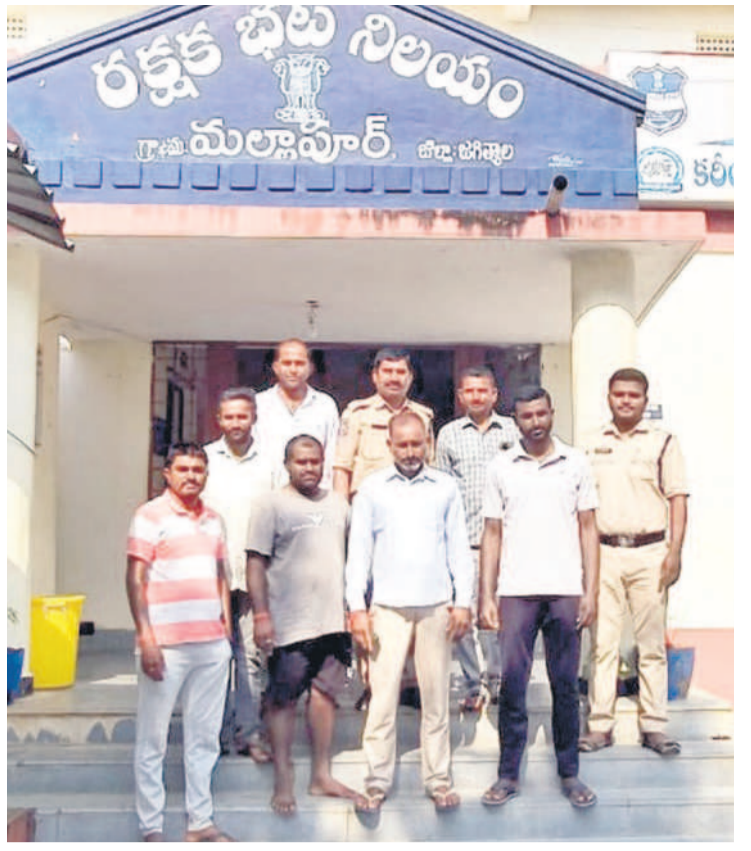
మల్లాపూర్లో పోలీస్ స్టేషన్లో ఎదుట రైతు సంఘాల నాయకులు