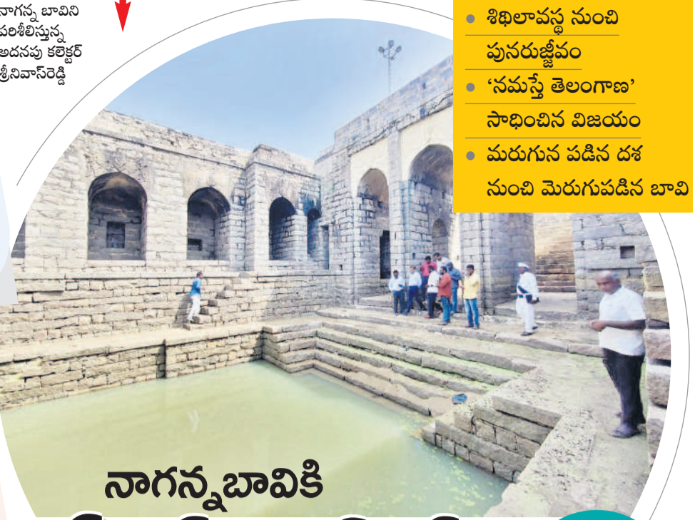
నాగన్నబావికి మహారోద నేడు ప్రారంభోత్సవం