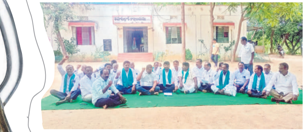
నందిపేట్ మండలకేంద్రంలో ధర్నాచేస్తున్న బిక్కుకార్యాలయ కమిటీ ప్రతినిధులు, రైతులు

నమస్తే తెలంగాణ యంత్రాంగం, సెప్టెంబర్ 19 : రూ.2 లక్షల రుణ మాఫీ కోసం ఉద్యమాన్ని ప్రారంభించిన రైతులు ఆందోళనలు కొనసాగిస్తున్నారు. ఆర్డర్ డివిజన్లోని అన్ని తహసీల్ కార్యాలయాల ఎదుట గురువారం బైరాయింపారు. ఆర్డర్, మాక్లూర్, నందిపేట్, అలూర్, మోరార్, వెల్లూర్, జిల్లాపల్లె తదితర మండలాల్లోని తహసీల్ ఆఫీసుల ఎదుట ధర్నా చేపట్టారు. మాట ఇచ్చి మోసం చేసిన కాంగ్రెస్ పార్టీకి వ్యతిరేకంగా నినాదాలు చేశారు. కాంగ్రెస్ పార్టీ చెప్పినట్లు రూ.2 లక్షల రుణమాఫీ చేయాలని రైతు బిక్కు కార్యాలయ కమిటీ ప్రతినిధులు డిమాండ్ చేశారు. మామూలులు చెప్పి అధికారంలోకి వచ్చిన కాంగ్రెస్ రైతులను మోసం చేసింది