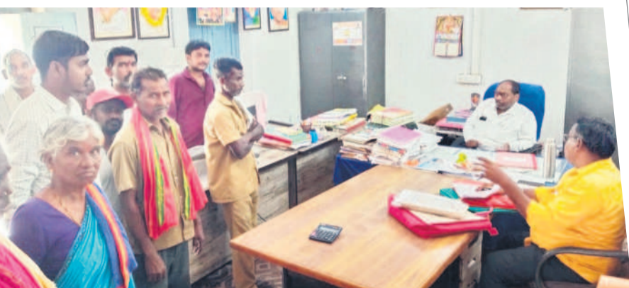
కమ్యూనిటీ వేతనాలు ఇవ్వాలని కోరుతున్న పాలకుల కార్యకర్తలు