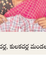
సీలమ్మ, బండవెల్లిపల్లె, కులకచర్ల మండలం

కుట్టిన రెండు జతలకు ప్రభుత్వం డబ్బులు ఇయ్యలే. యూనిఫామ్ కుట్టిన వెంటనే డబ్బులు చెల్లిస్తామని చెప్పారు. కానీ ఇప్పటివరకు డబ్బులు మంజూరు కాలేదు. అధికారులు మొదటి యూనిఫామ్లకు డబ్బులు చెల్లించడంలో పాటు రెండో యూనిఫామ్లకు కూడా డబ్బులు చెల్లించాలి.