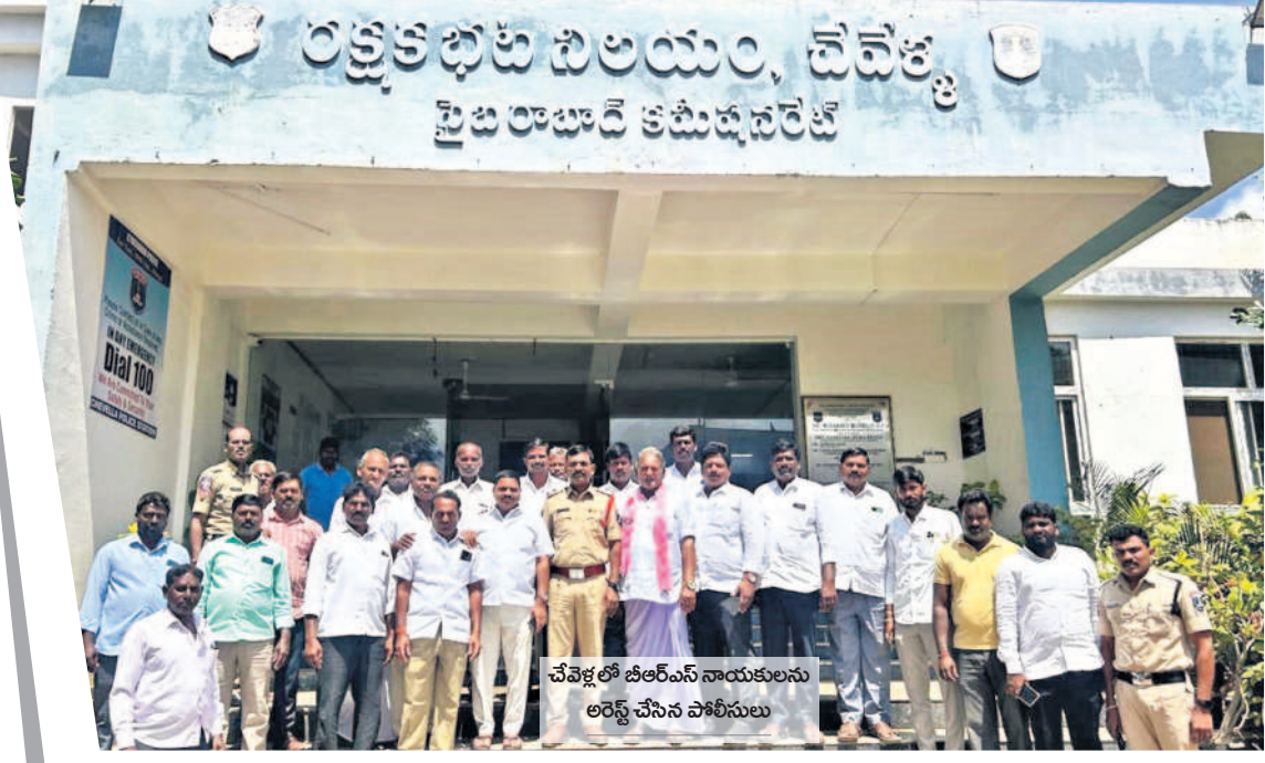
చేవెళ్లలో జిల్లా అధికారులు అరవేపే చేసిన పాటికే