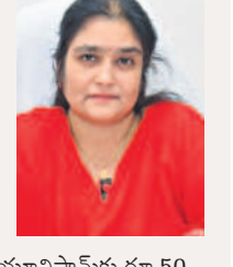
రేణుకాదేవి, డీఆర్డీపి వికారాబాద్

రెండో జత యూనిఫామ్లకు సంబంధించి ఎస్ఎంసీలకు కుట్టు కూలీ డబ్బులు ఇంకా ప్రభుత్వం నుంచి రాలేదు. ఒక్కో జతకు రూ.75 చొప్పున ఇవ్వాలి ఉన్నది. అయితే మొదటి జత యూనిఫామ్లకు రూ.50 చొప్పున ఎస్ఎంసీలకు డీఆర్డీపి ద్వారా అందజేశారు. మిగతా రూ.25 నెర్వ ద్వారా అందిస్తారు. ఇప్పటివరకు జిల్లాలో 97 శాతం విద్యార్థులకు రెండు జతల యూనిఫామ్లను అందజేశారు. ఒక్క శాతం మండలంలో మాత్రమే వెండింగ్ ఉంది త్వరలోనే పంపిణీ చేస్తారు.