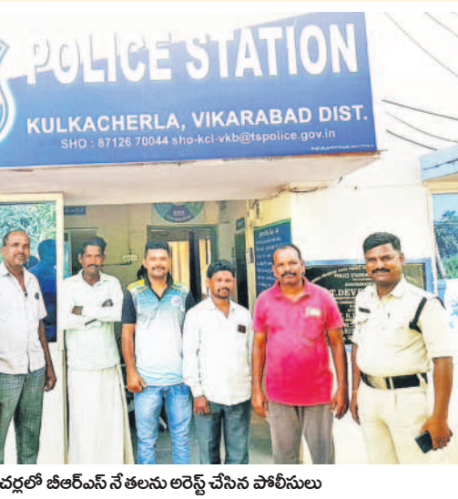
కులకచర్లలో బీఆర్ఎస్ నేతలను అరెస్టు చేసిన పోలీసులు

చలో ప్రజాభవన కు పిలుపునిచ్చిన బాధిత రైతాంగం మద్దతుగా నిలిచిన బీఆర్ఎస్ పార్టీ ప్రజాభవనకు బయలుదేరిన జిల్లా నేతలను ఎక్కడికక్కడ అరెస్టు చేసిన పోలీసులు ప్రభుత్వ చర్యలపై మండిపడుతున్న బీఆర్ఎస్ శ్రేణులు, ఉమ్మడి జిల్లా రైతాంగం