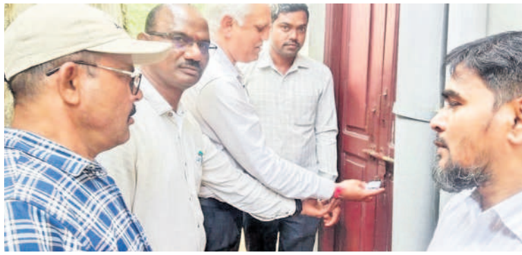
చౌదాపూర్ మండల కేంద్రంలో అనుమతి లేని క్షినిక్ సీజ్ చేస్తున్న జిల్లా వైద్యాధికారులు (ఫైల్)