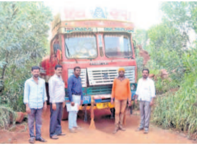
సంగారెడ్డి జిల్లా న్యారేకల్ మండలంలో గణేశపూర్ శివారులోని అనుమతి లేకుండా వెళ్తున్న లారీని నిట్టుకున్న మైనింగ్ శాఖాధికారులు