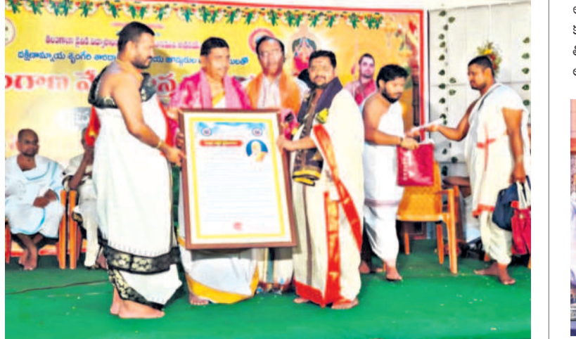
దుబ్బాక ఎంపీడిపీ వేదోపాసన శర్వకు ప్రతీకా వర్తం లండన్ జేస్తున్న ప్రతినిధులు