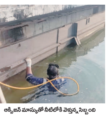
ఆక్సిజన్ మాస్కుతో నీటిలోకి వెళ్తున్న సిబ్బంది

కడెం, సెప్టెంబర్ 20: కడెం ప్రాజెక్టు వరదగోల్ల సుంచి నీటి లీకేజీ అరికట్టేందుకు అధికారులు చర్యలు చేపడుతున్నారు. ఈ ప్రాజెక్టుకు ఇండియాలో తయారు చేసిన నవి 9 గేట్లు, జర్మనీ దేశానికి చెందిన మరో 9 గేట్లు ఉన్నాయి. ప్రతి ఏడాది లీకేజీల రూపంలో పెద్ద మొత్తంలో నీరు వృథాగా పోతుండడంతో యాసంగి పంటలకు నీరు అందని పరిస్థితి నెలకొన్నది. దీంతో అధికారులు లీకేజీలను అరికట్టేందుకు చర్యలు చేపట్టారు. ఈ పనులను ఆంధ్రప్రదేశ్ లోని పశ్చిమ గోదావరికి చెందిన అరుణ అండ్ కో వాటర్ మేనేజ్మెంట్ సంస్థ చేపట్టింది. సిబ్బంది ఆక్సిజన్ మాస్కులు ధరించి నీటిలో వరదగోల్ల కిందకి వెళ్లి కాటన్ వెస్టింగ్ లీకేజీలను అరికట్టేందుకు చర్యలు చేపట్టారు.