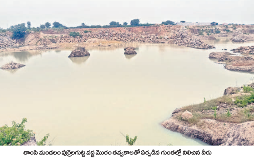
తాసి మండలం పుల్లెగుట్ట వద్ద మొరం తవ్వకాలతో ఏర్పడిన గుంతల్లో నిలిచిన నీరు