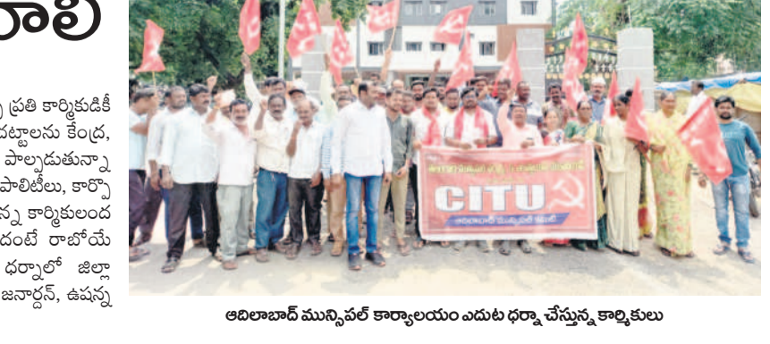
ఆదిలాబాద్ మున్సిపల్ కార్యాలయం ఎదుట ధర్నా చేస్తున్న కార్మికులు