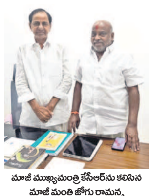
మాజీ ముఖ్యమంత్రి కేసీఆర్ ను కలిసిన మాజీ మంత్రి జోగు రామన్న

ఎదులాపురం, సెప్టెంబర్ 20 : తెలంగాణ తొలి సీఎం, బీఆర్ఎస్ అధినేత కేసీఆర్ సారథ్యంలో తెలంగాణ రాష్ట్ర మొదటి మంత్రి జోగు రామన్న కేసీఆర్ సారథ్యంలో తెలంగాణ రాష్ట్ర మొదటి మంత్రి జోగు రామన్న సంతోషం వ్యక్తం చేశారు. మాజీ సీఎం కే చంద్రశేఖర్ రావు మాజీ మంత్రి జోగు రామన్న శుభవారం గజెల్లెత్తు సమీపంలోని ఫామ్ హౌస్ లో మర్యాదపూర్వకంగా కలిశారు. ఈ సందర్భంగా పలు విషయాలపై కేసీఆర్ తో కలిసి సుదీర్ఘంగా చర్చించారు. నైతికంగా జోగు రామన్న ఓటమి కాదని రామన్న రోజుల్లో మరన్ని విజయాలను అందుకుంటామన్నారు. ఎలాంటి ఎన్నికలైనా బీఆర్ఎస్ పార్టీకి ప్రజలు బ్రహ్మాండం పడతారని, తిరిగి ఆదిలాబాద్ లో జోగు రామన్న విజయం భాయం అవుతుందని పేర్కొన్నారు. ప్రజా సమస్యలపై ప్రజాక్షేత్రంలో ఉంటూ ప్రజా ఉద్యమంలో పాల్గొనాలని కేసీఆర్ పిలుపునిచ్చారు.