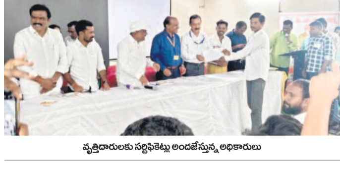
వృత్తిదారులకు సర్టిఫికేట్లు అందజేస్తున్న అధికారులు