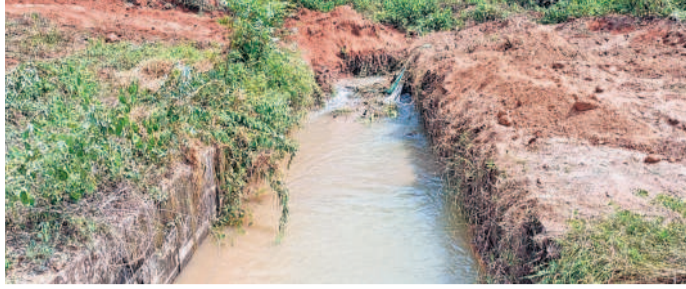
హుస్సాబాద్ ఎల్లమ్మ చెరువు పెద్ద తూము నుంచి వ్యధానా పోతున్న నీళ్ళు

హుస్సాబాద్, సెప్టెంబర్ 20 : హుస్సాబాద్ పట్టణ శివారులోని ఎల్లమ్మ చెరువు పెద్ద తూము లీకేజీ కారణంగా చెరువులోని నీళ్ళన్నీ వ్యధానా పోతున్నాయి. చెరువు నీటి ఇరువైపున ఉన్న గ్రామాల్లో అరికట్టడంలో స్థానికులు బాధపడుతున్నారు. తూము ద్వారా ధారాళంగా నీరు పోతున్నా పట్టణంకు నీరు కరువయ్యారు.