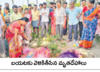
బయటకు వెళుకొనిన మృతదేహాలు

మిస్సెంబర్ రోదంబుల తల్లి, కూతురు ఆత్మహత్య చేసుకోవడంతో కుటుంబ సభ్యుల ఆందోళన మిస్సెంబరు. స్వందన స్థానిక బాలికల ఉన్నత పాఠశాలలో 9వ తరగతి కుటుంబం నుండి స్వందనను అందరినీ విషయం తెలుసుకున్న తోటి విద్యార్థులు బావిలో జాలరులు, రెస్క్యూ టీం సహాయంతో వెతుకగా శారద మృతదేహం దొరికింది. స్వందన మృతదేహం కోసం తీవ్రంగా గుర్తిచేచగా, మద్దూర్నాం లభ్యమైంది. వీరి మృతదేహాలను పోస్టుమార్టుకు తరలించారు.