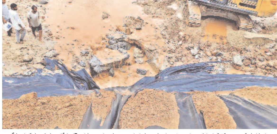
ఇటీవల కులసిన భారీ వర్షంతో సాగర్ ఎడమ కాల్వకు ఖమ్మం జిల్లా కూసుమంచి మండలం హాట్స్పాట్ వద్ద గండిపడింది. దానిని మరమ్మత్తులు ప్రారంభంతో శనివారం నుంచి సాగర్ నీటిని విడుదల చేయాలని అనుకునేలోగానే పాలేవూరు వద్ద యూటీ ప్రాంతంలో మరో గండిపడింది.

హైదరాబాద్, సెప్టెంబర్ 21 (నమస్తే తెలంగాణ): రాష్ట్రంలో ఆర్థిక శాఖ బిల్లుల మంజూరు హాట్ టాపిక్ గా మారింది. తమ శాఖల పరిధిలో బిల్లులు మంజూరు కావడం లేదని, తాము సిఫార్సు చేసినా చిన్న కాంట్రాక్టర్లకు కాకా బిల్లులు రావడం లేదని కొన్ని సమావేశాల్లో మంత్రులు ఆసహ్యం వ్యక్తం చేసిపట్టిన సమావేశం. రూ. 5-10 లక్షలకు కూడా ఆర్థిక శాఖ మంత్రి వైదే చూడాలా? ఇలా అయితే మాకు మంత్రి వదపులు ఎందుకు? అని ఒకరి ధర్మ గట్టిగానే మాట్లాడినట్లు సమావేశం వర్గాల్లో కోరుగా వర్ణన జరుగుతున్నది. ఒకప్పుడు అమాత్యుల ఆవేదన ఇలా ఉండగా బిల్లుల విషయంలో ఒకటి కాదు.. రెండు కాదు.. వందల కోట్లు చేతులు మారుతున్నాయన్న ఆరోపణలు గుప్పుముంటున్నాయి. నిప్పు లేనిది పొగ రాదు అన్నట్లు ఆర్థిక శాఖలో జరుగుతున్న వసూళ్ల గురించి గుసగుసలు వినిపిస్తున్నాయి. ప్రభుత్వం కాంగ్రెస్ పార్టీ ప్రభుత్వాన్ని ఏర్పాటు చేసి తొమ్మిది నెలలే అయింది. కొత్తగా పరిపాలన అనుమతులు ఇచ్చి ప్రారంభించిన పెద్ద ప్రాజెక్టులే లేవు. కానీ, గత ప్రభుత్వంలో మొదలైన ప్రాజెక్టులు పూర్తి అవుతుండటంతో కాంట్రాక్టర్లు బిల్లుల కోసం ఆర్థిక శాఖ చుట్టూ తిరుగుతున్నారు. కాంట్రాక్టర్ల మాత్రమే కాదు.. ప్రభుత్వ ఉద్యోగులు > 11వ పేజీలో