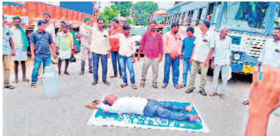
నాలుగు నెలలుగా పెండింగులో ఉన్న పాల బిల్లులను చెల్లించాలని డిమాండ్ చేస్తూ కల్వకుర్తి పాలశీతలకరణ కేంద్రం ఎదుట కల్వకుర్తి-హైదరాబాద్ ప్రధాన రహదాపై ధర్నా చేస్తున్న పొడి రైతులు

అంగట్లో రేషన్ డీల్ పోస్టులు పోస్టులు అమ్ముకుంటున్నారన్న కాంగ్రెస్ కార్యకర్త హస్తం కండువా కప్పుకుంటేనే రేషన్ దుకాణం బీఆర్ఎస్ కార్యకర్తలపై కాంగ్రెస్ సీనియర్ నేత కక్ష > 10