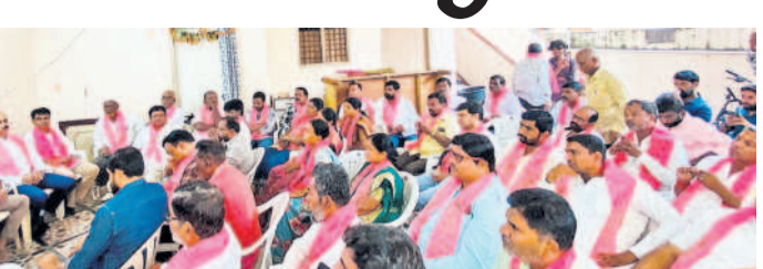
శేరిలింగంపల్లి నియోజకవర్గం బీఆర్ఎస్ ముఖ్య నాయకుల సమావేశానికి హాజరైన బీఆర్ఎస్ శ్రేణులు

శేరిలింగంపల్లి, సెప్టెంబర్ 21: శేరిలింగంపల్లి బీఆర్ఎస్ పార్టీ ముఖ్య నాయకుల సమావేశం శనివారం భాజగూడలోని బీఆర్ఎస్