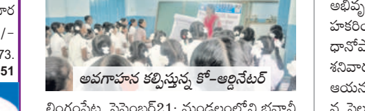
అవగాహన కల్పిస్తున్న కో-ఆర్డినేటర్