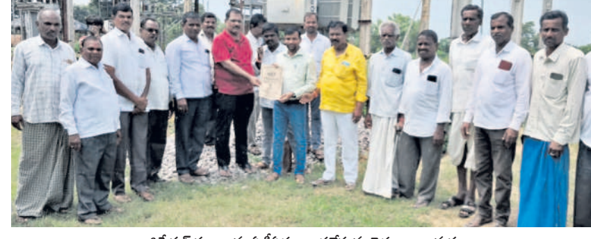
లిజిస్ట్రేషన్ పత్రాలను ఏడీపీకు అందజేస్తున్న రైతులు, గ్రామస్థులు

భిక్కనూరు, సెప్టెంబర్ 21 : లో వోల్టేజీ నివారణకు ప్రత్యేక చర్యలు తీసుకుంటున్నామని విద్యుత్ శాఖ ఏడీపీ కిరణ్ చైతన్య తెలిపారు. మండలంలోని కాచాపూర్ గ్రామంలో అదనపు విద్యుత్ ట్రాన్స్మిషన్ డివ్యూలుకు రిజిస్ట్రేషన్ చేసిన భూమి పత్రాలను గ్రామస్థులు అయిన శనివారం అందజేశారు. అనంతరం మాట్లాడుతూ.. గ్రామంలో విద్యుత్ సమస్య ఉండడంతో మరో ట్రాన్స్మిషన్ డివ్యూలు చేయనున్నట్లు తెలిపారు. ఇందుకోసం స్థలం లెక్కపడడంతో ట్రాన్స్మిషన్ డివ్యూలు అల