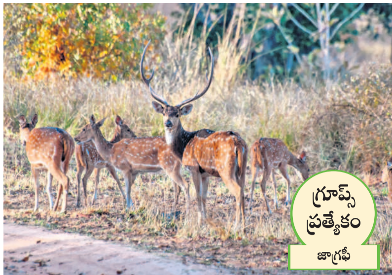
గ్రూప్స్ ప్రత్యేకం జాగ్రహీ

దేశవ్యాప్తంగా మైదానాలు, పీఠభూములు, పర్వత ప్రాంతాల్లో అడవుల శాతం ఎలా ఉందాలో జాతీయ అటవీ విధానం-1952 సూచనలు చేసింది. 1988 జాతీయ అటవీ విధానం కూడా తగిన సూచనలిచ్చింది. అడవి జంతువులు, అటవీ ఆధార పరిశ్రమలు, అటవీ ఉత్పత్తి శుద్ధి కేంద్రాలు తదితర వివరాలు తెలుసుకుందాం.