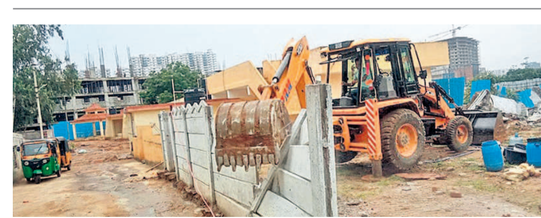
కోకాపేటలో సర్వే నంబర్ 147లో అక్రమ నిర్మాణాలను కూల్చివేస్తున్న దృశ్యాలు