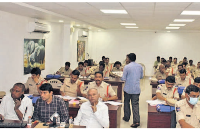
సమావేశానికి హాజరైన జిల్లాలోని పోలీసులు అధికారులు

వికారాబాద్ ఎస్సీ నాయకులరెడ్డి పోలీసు అధికారులతో సమీక్ష