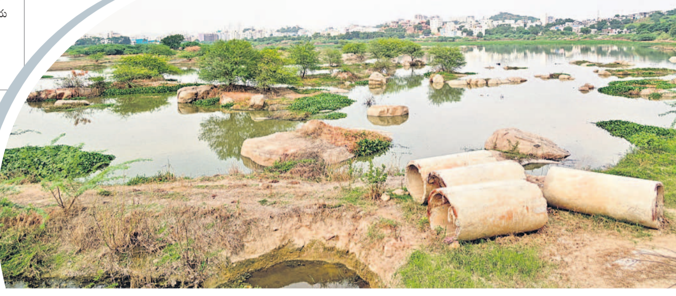
కలుపు మొక్కలతో నిండి ఉన్న నెల్లూరు పెద్ద చెరువు

I హైదరాబాద్, ఆదివారం 22 సెప్టెంబర్ 2024 RANGAREDDY