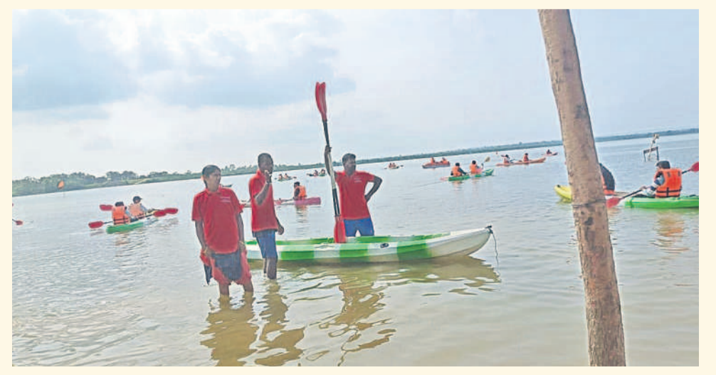
కోట్పల్లి ప్రాజెక్టు వద్ద శనివారం పర్యాటకులు సందడి చేశారు. ఆహారకరమైన ప్రాజెక్టు అందాలను తిలకించడంతోపాటు బోటింగ్ చేస్తూ ఆనందంగా గడిచారు. సిబ్బంది పర్యాటకులకు ఎలాంటి ఇబ్బందులు తలెత్తకుండా ఏర్పాట్లు చేశారు. బోటింగ్ చేసేవారికి రక్షణగా దుస్తులను ఇచ్చారు. సెల్ఫీలు దిగుతూ పర్యాటకులు సందడి చేశారు. ఎలాంటి అవాంఛనీయ సంఘటనలు జరిగినా వెంటనే తెలుసుకునేలా ప్రాజెక్టు పరిసర ప్రాంతాల్లో సీసీ కెమెరాలను ఏర్పాటు చేశారు. - ధారురు, సెప్టెంబర్ 21

కోట్పల్లి ప్రాజెక్టు వద్ద పర్యాటకుల సందడి