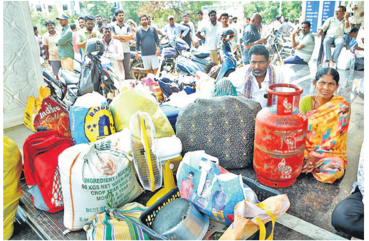
అమీన్పూర్లోని కిష్టారెడ్డిపేటలో హైద్రా కూల్చివేతలతో వీధిన పడిన కుటుంబాలు