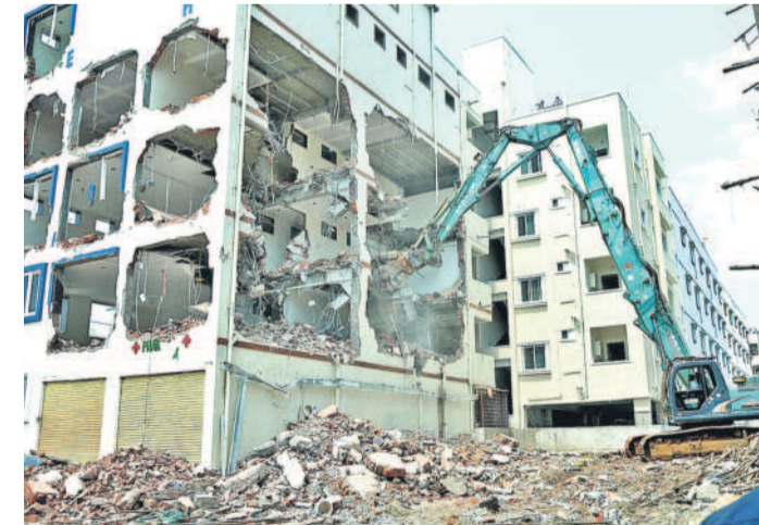
కిష్టారెడ్డిపేటలో హైద్రా కూల్చివేసిన బిన్సపిల్లల దావాఖాన

నల్లచెరువు వద్ద కూల్చివేతను అడ్డుకుంటున్న మహిళను లాక్కెత్తున్న పోలీసులు