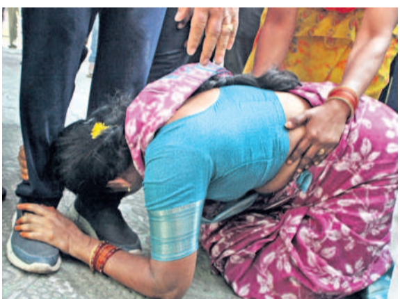
కాకట్లపల్లి నల్లచెరువు వద్ద అధికారి కాళ్ళపై పడి రోదెస్తున్న బాధితురాలు