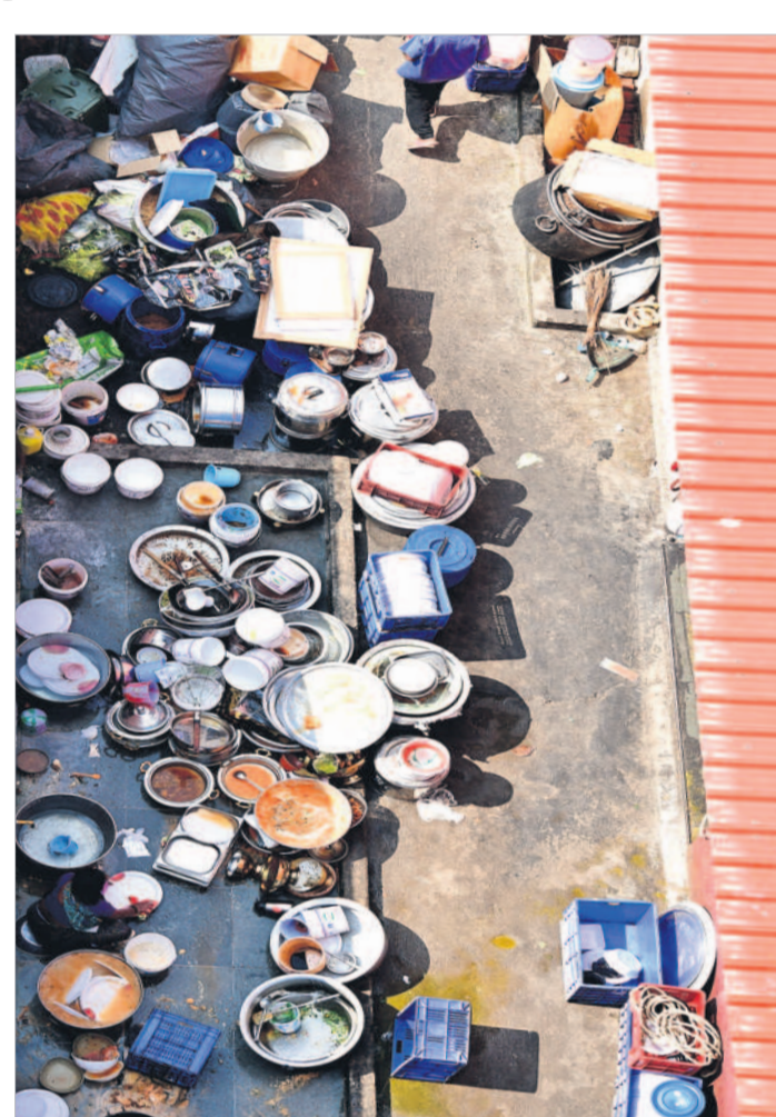
కాకట్లపల్లి నల్లచెరువు వద్ద హైద్రా కూల్చివేతలతో వీధిన పడ్డ బాధితుల సాగుగి