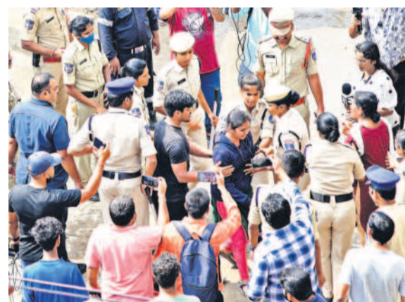
నల్లచెరువు వద్ద కూల్చివేతలను అడ్డుకుంటున్న స్థానికులు