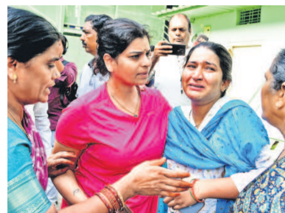
ఇల్లు కూల్చివేయడంతో ఎక్కడికి వెళ్లాలి తెలియక రోదెస్తున్న గర్భిణి