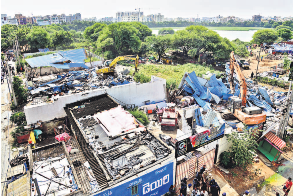
కాకట్లపల్లిలోని నల్లచెరువు వద్ద అదివారం ఉదయం భవనాలను కూల్చివేస్తున్న హైద్రా