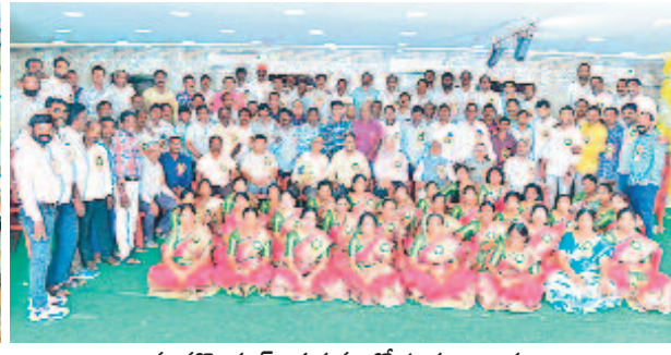
మానకొండూర్ : గురువులతో పూర్వ విద్యార్థులు