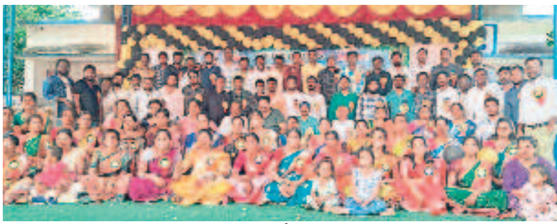
చిగురుమామిడి : ఇందుర్తిలో పాల్గొన్న పూర్వ విద్యార్థులు

అనంతరం ఆనాటి మధుర జ్ఞాపకాలను సమర్పించుకున్నారు. పూర్వ విద్యార్థులు పాల్గొన్నారు. ఇందులో.. చిగురుమామిడి: మండలంలోని ఇందుర్తి గ్రామంలోని ప్రభుత్వ ఉన్నత పాఠశాలలో 2005-2006కి చెందిన పూర్వ విద్యార్థులు ఆ పూర్వ సమ్మేళనం నిర్వహించారు. చిన్నవాటి స్నేహితులతో కలిసి చదువుకున్న అదే పాఠశాల వేదికపై వంద మంది పూర్వ విద్యార్థులు అత్యున్నత సమ్మేళనంలో పాల్గొన్నారు. ముందుగా గురువులను ఆహ్వానించి, శాలువారో సన్మానించారు. కేశవపట్నం హైస్కూల్: శంకరపట్నం మండలంలోని కేశవపట్నం హైస్కూల్