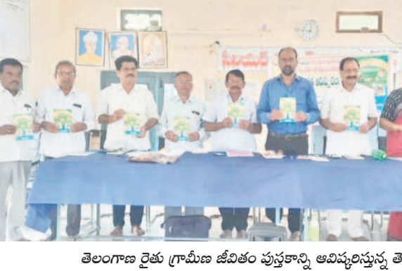
తెలంగాణ రైతు గ్రామీణ జీవితం పుస్తకాన్ని ఆవిష్కరిస్తున్న తెరవే బాధ్యులు