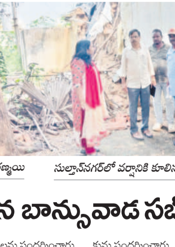
సుల్తాన్ నగర్లో వర్షానికి కూలిన ఇంటిని పరిశీలిస్తూ..