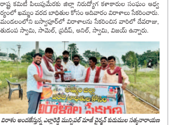
విరాళం అందజేస్తున్న ఎలారెడ్డి మున్సిపల్ మాజీ కమిషనర్ కుటుంబ సభ్యులారా

పాఠశాల చుట్టూ వెలిగిన చెట్లు, గడ్డి చిట్టడివిని తలపిస్తున్న పాఠశాల. పాఠశాల ఎదుట గ్రామ పంచాయతీ అధ్యక్షులతో పల్లె ప్రకృతి వన ఏర్పాటుచేశారు. చెట్లు వెలిగి చిట్టడివిని తలపిస్తున్నది. దానికోసం చుట్టూ ప్రహారీ కూడా లేకపోవడంతో విద్యార్థులు, ఉపాధ్యాయులకు ఇబ్బందులు ఎదురవుతున్నాయి. ఏండ్ల చరిత్ర కలిగిన పాఠశాలకు కనీస సౌకర్యాలు, వనరులు లేకపోవడం బాధాకరమని స్థానిక ప్రజలు అంటున్నారు. అధికారులు స్పందించి పాఠశాల, కాలేజీ చుట్టూ ఉన్న చెట్లు, పాదలను తొలగించి, ప్రహారీ నిర్మించి విద్యార్థుల ఇబ్బందులు తొలగించాలని వారి తల్లిదండ్రులు, స్థానికులు కోరుతున్నారు.