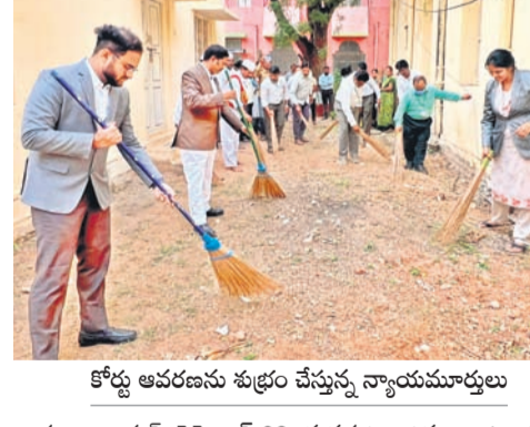
కోర్కె ఆవరణను శుభ్రం చేస్తున్న న్యాయమూర్తులు