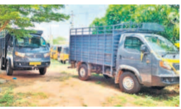
వీడిఎస్ బియ్యం తరలిస్తూ పట్టుబడిన వాహనాలు (ఫైల్)

గద్వాల అర్బన్, సెప్టెంబర్ 23 : పేదల కడుపు నింపేందుకు ప్రభుత్వం ప్రతిష్టాత్మకంగా పంపిణీ చేస్తున్న రేషన్ బియ్యం పక్కదారి పడుతున్నది. అక్రమ మర్కూలు గట్టుపట్టుకు కాకుండా ఇతర రాష్ట్రాలకు తరలిస్తూ కోట్లకు పట్టుకున్నారు. పేదల ఆకలి తీర్చేందుకు ప్రభుత్వం అమలు చేస్తున్న రేషన్ బియ్యం అక్రమ మర్కూలు వరంగా మారింది. జిల్లాలో ప్రతినెలా అక్రమ దందా జోరుగా సాగుతున్నాయి. కొంతమంది సిండికేట్ గా మారి రేషన్ బియ్యంలో రిస్కెక్లింగ్ చేసి ఇతర రాష్ట్రాలకు తరలిస్తున్నారు. ఈ వ్యవహారంలో సంబంధిత శాఖ అధికారుల పాత్ర ఉన్నట్లు ఆరోపణలు వినిపిస్తున్నాయి.