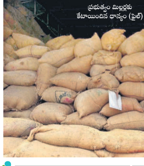
ప్రభుత్వం మిల్లర్లకు కేటాయించిన ధాన్యం (ఫైల్)

రూపాయి పెట్టుబడి లేకుండా ప్రభుత్వమే ధాన్యం ఇవ్వడం మర ఆడించిన తర్వాత 67 శాతం బియ్యం మాత్రమే తిరిగి ఇవ్వాలని నిబంధన ఉండడంతో మిల్లర్లు యజమానులకు బియ్యం వ్యాపారం కానుకుంటున్నట్లు తెలుస్తుంది. ప్రభుత్వం రైతుల వద్ద ధాన్యం కొనుగోలు చేసి మిల్లర్లకు మర ఆడించిన ఇవ్వడానికి ఉచితంగా ఇస్తుంటే ఎలాంటి పెట్టుబడి లేని వ్యాపారంగా మారింది. ఈ సీజన్లో ఇప్పటి వరకు ధాన్యాన్ని వెంటనే ప్రభుత్వానికి తిరిగి ఇవ్వకుండా కాలం యతున చేస్తూ సరకు ధాన్యాన్ని ఇతర రాష్ట్రాలకు విక్రయించుకుంటూ సొమ్ము చేసుకుంటున్నారు. చూస్తుండగానే మరో సీజన్ రావడం ప్రభుత్వం మళ్ళీ ధాన్యం ఇవ్వడం.. ధాన్యాన్ని మర ఆడించే కొంత మేరకు ప్రభుత్వానికి తిరిగి ఇవ్వడం, మరి కొంత పెండ్లి గోరే పెట్టడం ఇలా వరుసగా చేస్తూ రాజులు గడిస్తున్నారు.