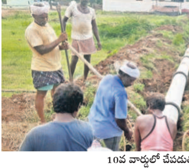
10వ వార్డులో చేపడుతున్న డ్రైనేజీ పనులు