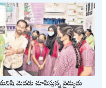
మనీషి మెదడు చూపిస్తున్న వైద్యుడు