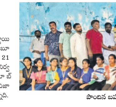
పోడిన బహుమతి, మెడల్ తో విద్యార్థులు

మహబూబ్ నగర్ అర్బన్, సెప్టెంబర్ 23: రాష్ట్రస్థాయి జూనియర్ బాల, బాలికల సాఫ్ట్ బాల్ పోటీల్లో మహబూబ్ నగర్ జిల్లా రెండోస్థానం దక్కించుకున్నది. ఈనెల 21 నుంచి 23 వ తేదీ వరకు రాజన్న సీరి ఫిట్ జిల్లాలో నిర్వహించిన పోటీల్లో సీమి ఫైనల్ లో సీమి ఫైనల్ లో మహబూబ్ నగర్ జిల్లా తలబడి 14-0 తో షెగ్గింది. ఫైనల్ లో విజామా బాదజిల్లతో పోడి రెండో స్థానం దక్కించుకున్నది.