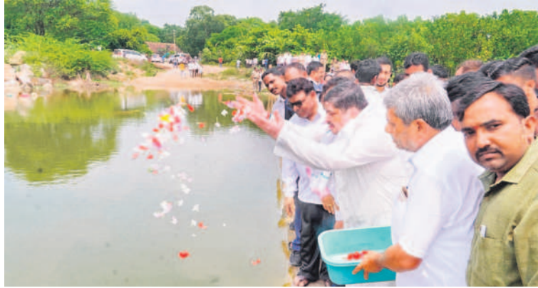
సిద్దిపేట జిల్లా కోహడ మండలంలోని శనిగిరం ప్రాజెక్టు వద్ద గంగమ్మ తల్లికి పూజలు చేస్తున్న రోడ్డు రవాణా, బీసీ సంక్షేమశాఖల మంత్రి పాన్సం ప్రభాకర్