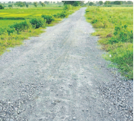
సిద్దిపేట జిల్లా ధూళిమిట్ల మండలంలో అర్ధంతరంగా పనిచేసిన రోడ్డు నిర్మాణ పనులు

మద్దూరు (ధూళిమిట్ల), సెప్టెంబర్ 23: సిద్దిపేట జిల్లా ధూళిమిట్ల మండలంలోని కొండాపూర్ నుంచి బెక్కల్ శివాలిండా మీదుగా రామవరం వైపుకు పలు మీటర్ల అంతరం బీటీ రోడ్డు మంజూరు చేసినది. గతేడాది రూ.4కోట్లు మంజూరు చేసిన బీటీ రోడ్డు నిర్మాణ పనులు ప్రారంభించింది. రోడ్డు నిర్మాణ పనులు దక్కించుకున్న కాంట్రాక్టర్ సుమారు 5 కిలోమీటర్ల దూరంలో కంకర పోసి మధ్యలోనే నిర్మాణ పనులు నిలిపివేశాడు. రోడ్డు నిర్మాణ పనులు మధ్యలోనే అర్ధంతరంగా నిలిపివేయడంతో కొండాపూర్, రామవరం గ్రామాలకు వైపుకు కంకర రోడ్లతో శివాలిండా ప్రజలు నానా ఇబ్బందులు పడుతున్నారు. కాంగ్రెస్ ప్రభుత్వం అధికారంలోకి రాగానే కాంట్రాక్టర్ రోడ్డు నిర్మాణ పనులు నిలిపివేయడంలో అంతర్యం ఏమిటని తండాపాసులు ప్రశ్నిస్తున్నారు.