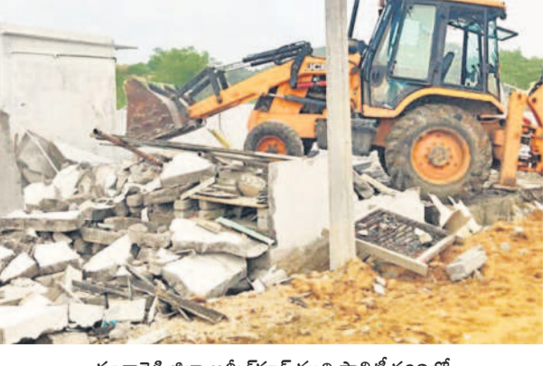
సంగారెడ్డి జిల్లా అమీన్పూర్ మున్సిపాలిటీ వద్ద అక్రమ నిర్మాణాలను కూల్చివేస్తున్న అధికారులు