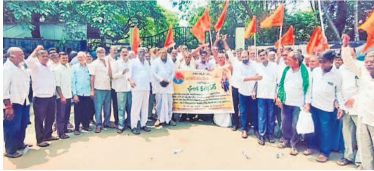
సంగారెడ్డి కలెక్టరేట్ ఎదుట ధర్మా చేస్తున్న భారతీయ కిసాన్ సంఘ నాయకులు, రైతులు

వచ్చాయిన్నారు. హనుమంకోడ జిల్లా భీమవేదవర పల్లి మండలంలోని మల్లారం క్రాసీ నుంచి పీడ బ్యూ రోడ్డు వరకు రూ.86లక్షలు, హవర్దావరపల్లి మండలంలోని మల్లారం క్రాసీ నుంచి పీడ బ్యూ రోడ్డు వరకు రూ.37లక్షలు, ముత్తూరు నుంచి గట్టనర్సింకాపూర్ క్రాసీరోడ్డు వరకు రూ.3.74 కోట్లు, కొమ్మూరు నుంచి కొత్తపల్లి రోడ్డు వరకు రూ.1.17కోట్లు, ఎత్తుతుర్తి మండలంలోని దామెర నుంచి కొత్తపల్లి రోడ్లకు రూ.3.47కోట్లు, దామెర నుంచి జడ్పీ రోడ్డు వరకు రూ.87లక్షలు, దండపల్లి నుంచి దేశకాణిపల్లి వరకు రూ.1.02 కోట్ల వచ్చినట్లు పేర్కొన్నారు. అధ్యక్ష నిర్మాణానికి... కోహడ మండలం గొట్టమిట్ల-నారాయణపూర్ మధ్య త్రిడ్డీ నిర్మాణానికి రూ.91.55 లక్షలు, కోహడ-మైసంపల్లికి రూ.57లక్షలు, చిగురుమామిడి మండలం పిడుపల్లి రోడ్డులో రూ.57లక్షలు, అంబాడిపల్లి-పీడుపల్లి మధ్య రూ.77లక్షలు, సైదాపూర్ మండలం పెర్లపల్లి-దుద్దెనపల్లి మధ్య రూ.3.47 కోట్లు, పెర్లపల్లి-సైదాపూర్ మధ్య రూ.3.47 కోట్లు, ఆకునూరు-గణపూర్ మధ్య రూ.57 లక్షలు. భీమవేదవరపల్లి మండలం ఎల్లగ -వంగర గ్రామం వద్ద రూ.87 లక్షలు, ఎల్ల తుర్తి మండలం జడ్పీ రోడ్డునుంచి బావులపల్లి రుణమాఫీ చేయాలనే దిమాంశం మండలం బావులపల్లి నుంచి బావులపల్లి వైకుంఠదాంం మధ్య కల్వర్లు నిర్మాణానికి రూ.52లక్షలు మంజూరైంట్లు మంత్రి పాన్సం వివరించారు.