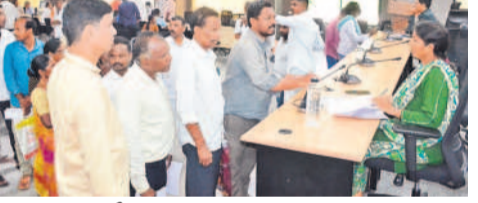
ధర్మానులు సీక్రెటరీలు, జిల్లా రెవెన్యూ అధికారి నాగరాజు

సిద్దిపేట కలెక్టరేట్, సెప్టెంబర్ 23: అధికారుల నుంచి తీసుకున్న ఫిర్యాదులను త్వరగా పరిష్కరించాలని సిద్దిపేట రెవెన్యూ అధికారి నాగరాజు అధికారులకు సూచించారు. సోమవారం కలెక్టరేట్లో ప్రజావాణిలో భాగంగా ఆమె ఫిర్యాదులు సీక్రెటరీలకు. ఈ సందర్భంగా మాట్లాడుతూ జిల్లా నలుమూలల నుంచి తమ సమస్యలను నేరుగా విన్నవించి పరిష్కరించుకోవడానికి అధికారులు కార్యాలయానికి వస్తారని, వారందరికీ న్యాయం చేయాలని సూచించారు. డిఆర్ఐవో డి.ఆర్.ఎమ్. ఆర్. అధికారులు పాల్గొన్నారు.