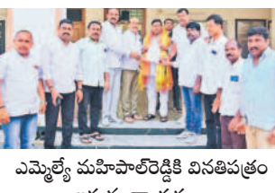
ఎమ్మెల్యే మహిపాల్ రెడ్డికి వినతిపత్రం ఇస్తున్న నాయకులు

గుమ్మడిపల్లి, సెప్టెంబర్ 23: మండలంలోని సల్లపల్లి అటవీ ప్రాంతంలో చేపట్టిన డంపింగ్ యార్డులను నిలిపివేయాలని ఎమ్మెల్యే గూడెం మహిపాల్ రెడ్డి బీఆర్ఎస్ గుమ్మడిపల్లి నాయకుల వినతిపత్రం అందజేశారు. సోమవారం కార్యాలయంలో ఎమ్మెల్యేను కలిసి సమస్యను వివరించి వినతిపత్రం అందజేశారు. పచ్చని అడవిని కలుషితం చేయొద్దని, డంపింగ్ యార్డు ఏర్పాటుకో రైతులకు, చుట్టూ గ్రామాల ప్రజలకు తీవ్ర ఇబ్బందులు కలుగుతాయని తెలిపారు. ప్రభుత్వం స్పందించి వెంటనే డంపింగ్ యార్డులను ఏర్పాటు కాకుండా చర్యలు తీసుకోవాలన్నారు. దీనికి ఎమ్మెల్యే సానుకూలంగా స్పందించినట్లు