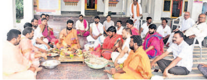
బసవేశ్వర ఆలయంలో ప్రాయశ్చిత్త హోమం నిర్వహిస్తున్న దృశ్యం