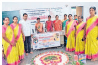
పోషక అభియాన్పై అవగాహన కల్పిస్తున్న అంగన్వాడీ టీచర్లు