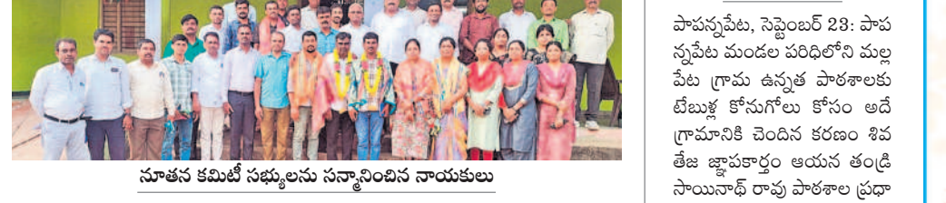
నూతన కమిటీ సభ్యులను సన్మానించిన నాయకులు

మెడక్ మున్సిపాలిటీ, సెప్టెంబర్ 23: పీఆర్టీయూ మండల కమిటీ ఎన్నికలకు ప్రభుత్వం అనుమతి తెలిపింది.