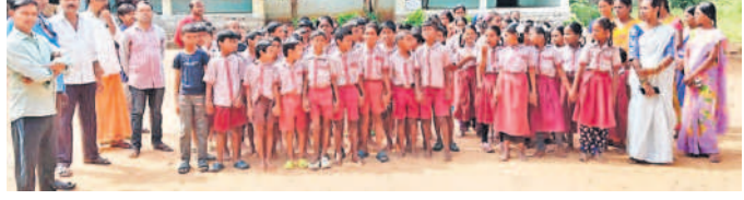
పాఠశాల ఆవరణలో నినాదాలు చేస్తున్న విద్యార్థులు, తల్లిదండ్రులు

నిజాంపేట, సెప్టెంబర్ 23: ఉపాధ్యాయులు కావాలంటూ విద్యార్థులు నినాదాలు చేశారు.