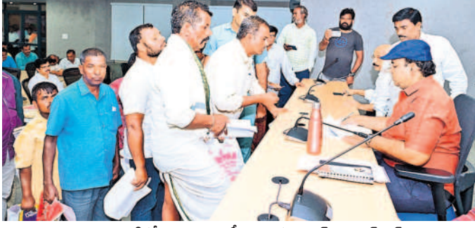
ప్రజావాణిలో దరఖాస్తులు స్వీకరిస్తున్న కలెక్టర్ రాహుల్ రాజ్

మెడక్, సెప్టెంబర్ 23 (నమస్తె తెలంగాణ): ప్రజావాణి దరఖాస్తులను పరిశీలించి ఎప్పటికప్పుడు పరిష్కరించాలి కలెక్టర్ రాహుల్ రాజ్ అధికారులను ఆదేశించారు.