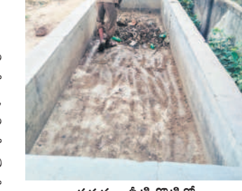
పశువుల సేటి తొట్టిలో చెత్తను తొలిగిస్తున్న కార్మికులు

నిజాంపేట, సెప్టెంబర్ 23: నిజాంపేటలోని మూల కులముఖం అభివృద్ధి భవన్ మంజూరు చేయాలి.