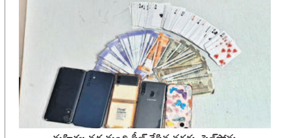
మహిళల వద్ద నుంచి సీట్ చేసిన నగదు, సెల్ ఫోన్లు